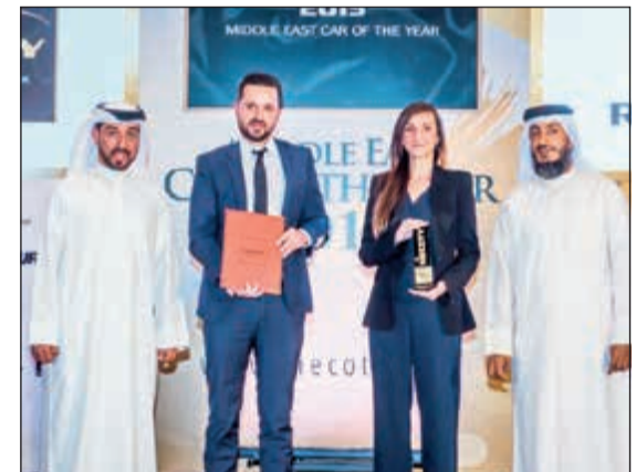
ممثلو «رينو» خلال تسليمهم الجوائز

المميز الذي ينقل الابتكار في عالم السيارات إلى المستقبل، توجت سيارة رينو Zoe Z.E 40 إنجازات سيارات رينو في حفل توزيع الجوائز عبر 40 إنجازات لخدمة التحكيم في فئة السيارات الكهربائية متفوقة على سيارة منافسة واحدة. وتعزز هذه السيارة بالطاقة الكهربائية بنسبة 100٪ التزام رينو بتطوير وتصميم سيارات صديقة للبيئة للمستهلكين الواعين بأهمية المحافظة على البيئة. وفي معرض حديثه