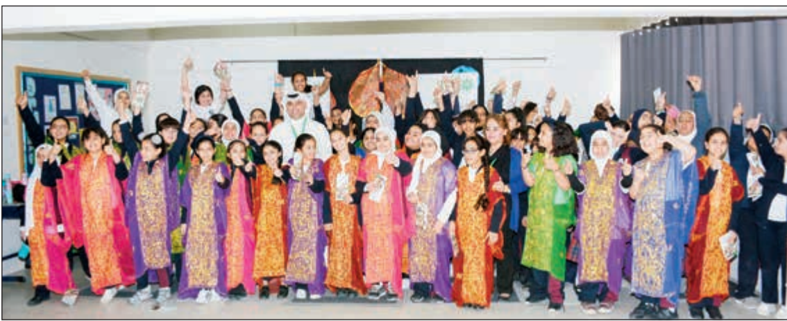
ممثلو البنك مع طالبات المدرسة الإنجليزية للبنات

أطلق بيت التمويل الكويتي «بيتك» كآول بنك في الكويت بطاقة فيزا إنفينيت الائتمانية ذات التصميم الحصري بتصميمها المعدني لعملاء الخدمات المالية الخاصة في «بيتك» بمزايا استثنائية، ضمن إطار الاهتمام بالعميل والحرص على مكافآته، والاستمرار في ابتكار باقة متنوعة من الخدمات والمنتجات المصرفية التي تلبى تطلعات العملاء وتعزز مكانة البنك الرائدة عالمياً. وقال مدير عام الخدمات المالية الخاصة في «بيتك» - عبدالله الجمع أن بطاقة فيزا إنفينيت الائتمانية تعتبر أفضل منتج مقدم من فيزا تم تصميمه حصرياً لعملاء الخدمات المالية الخاصة تتيح لهم تجربة فريدة ورائعة للاستمتاع بعالم من المكافآت الحصرية والسفر والمطاعم الفاخرة، وتجارب التسوق الأكثر استثنائية، وغيرها الكثير من المزايا الأخرى التي تم اختيارها بعناية، والتي صممت خصيصاً لتناسب أسلوب حياتهم وتطلعاتهم بشكل أفضل.