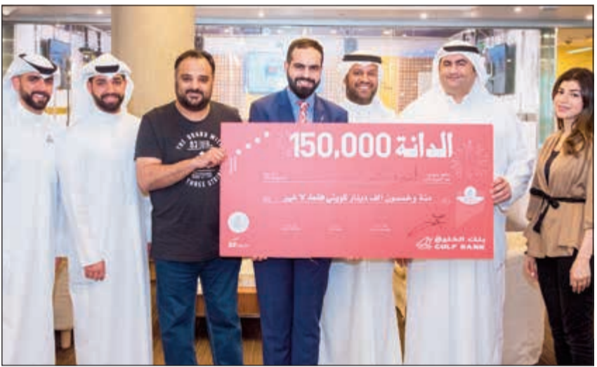
ممثلو بنك الخليج في ضيافة راديو نبض الكويت 88.8 إف إم

دينار من الحساب على أساس شهري لحين استيفاء الحد الأدنى للرصيد. أما بالنسبة للمعملاء الذين يفتحون حساب الدانة أو يودعون مبالغ أكثر في الحساب، فيتأهلون للدخول تلقائياً إلى السحوبات الأسبوعية في غضون يومين. وللمشاركة في سحوبات الدانة ربع السنوية والسحب المقبلة في عام 2019، يتعين على المعملاء الاحتفاظ بالرصيد المطلوب.