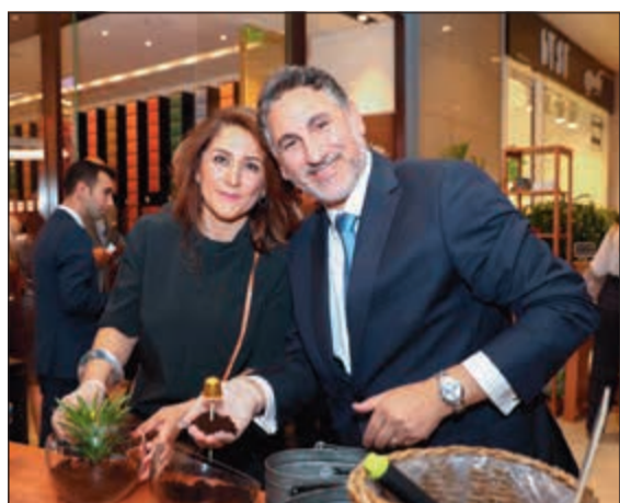
جانب من إطلاق مبادرة «نيسبريسو»

التدريب والمساعدة الفنية لمزارعي البن لتحسين جودة الإنتاج وتعزيز ممارسات الزراعة المستدامة ورفع إنتاجية المزارع. وتعهدت «نيسبريسو» بشراء 100 من البن الذي ينتجه المزارعون المدرجون في برنامج AAA مع إمدادها بأفضل أصناف البن بالتوازي مع حماية البيئة وتعزيز رفاهية المزارعين. وللحد من البصمة الكربونية لمنتجاتها، أجرت «نيسبريسو» تقييما لدورة حياة المنتجات لتصبح لدى الشركة فكرة واضحة عن كل خطوة من خطوات الأعمال وكيف يمكن أن يصبح كل جانب منها أكثر استدامة. وكانت النتيجة تعهد «نيسبريسو» بإدراج 100٪ من البصمة الكربونية التشغيلية لمنتجاتها في برنامج إعادة التدوير مع خدمة جمع كبسولات الألمنيوم من 2011 كلفت «نيسبريسو» فريق كوانتيس