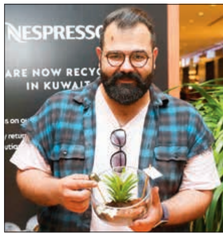
تشجيع على حماية البيئة