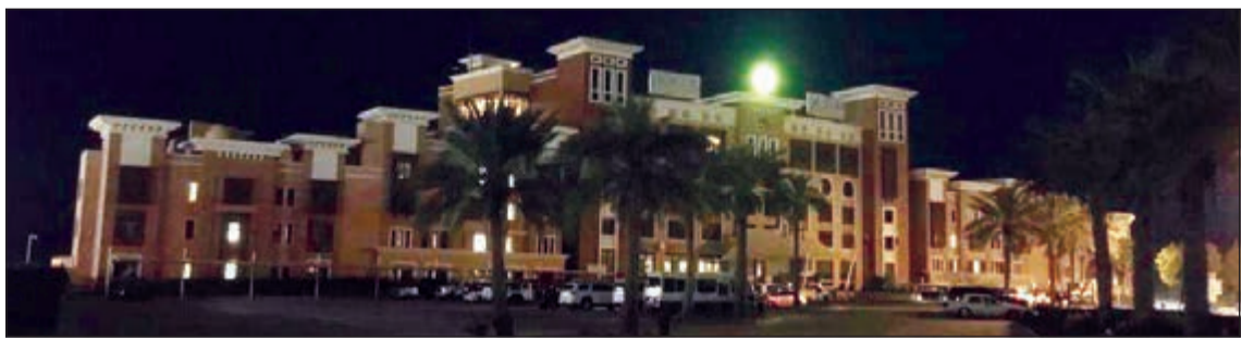
سفير الفنتاس خلال «ساعة الأرض»

كعادة فندق سفير الفنتاس الكويت أن يشارك في «ساعة الأرض» لاستقبال مشرق دوما، احتفل الفندق بهذه المناسبة من خلال إطفاء الأنوار لدعم نشاط ساعة الأرض التي أنشأها الصندوق العالمي للحياة البرية (WWF)، وذلك يوم السبت 30 مارس 2019، حيث تم استخدام الإضاءة غير الكهربائية وإيقاف الإضاءات المتبقية، بما في ذلك الديكورات المضاءة، المطاعم، الواجهات الخارجية والأماكن العامة الأخرى.