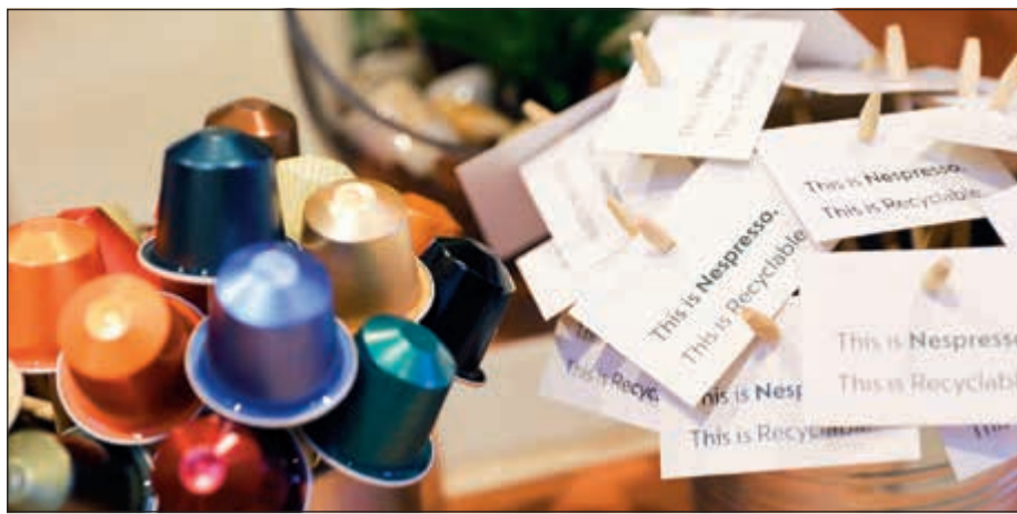
«نيسبريسو»... إعادة تدوير وحماية للبيئة