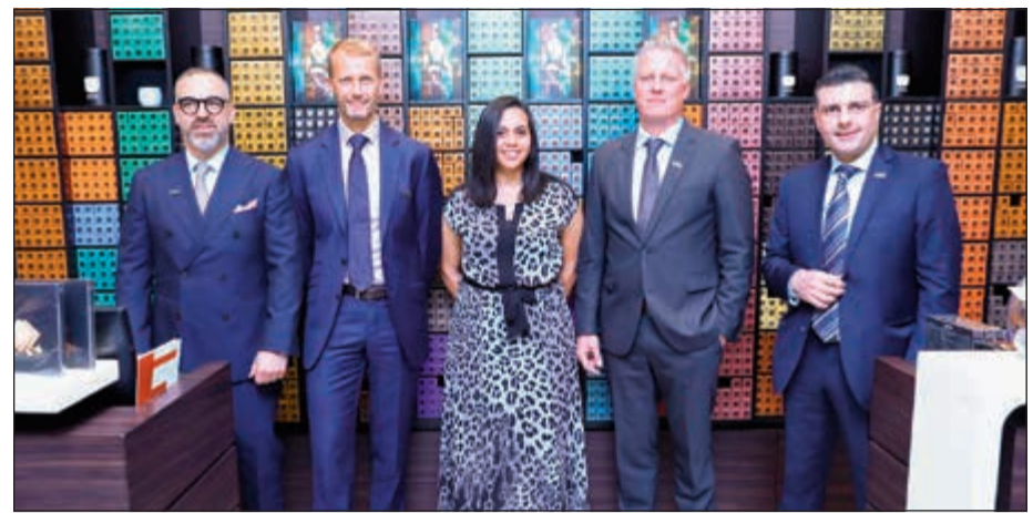
«نيسبريسو»... تسعى دائما للحفاظ على البيئة

تستمر في استثمارها موارد كبيرة لتمويل البرنامج دون أن يتحمل المستهلك أي تكلفة إضافية