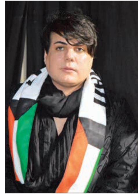
مصمم الأزياء العالمي نواف البدر

من قال ان في زمن القطط يسقط الجمال وتتوارى ايادي المبدعين عن تلوين الحياة؟ فلبنان اثبت مرة اخرى انه مهما كثرت فيه المتناقضات ومهما تعاطمت المحن والخيبات يبقى المركز العربي الاول لاستقطاب اهل الفن والموضة والجمال، وهو مصمم الأزياء العالمي الكويتي نواف البدر يختار منصة البيلال في بيروت ليبسط سحر تصاميمه ويتألق في تسيير العارضات لإبهار عيون المدعوين بجديد ابداعاته وتصاميمه.