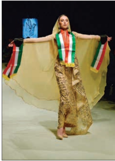
ثوب ذهبي اللون موشحا بعلم الكويت