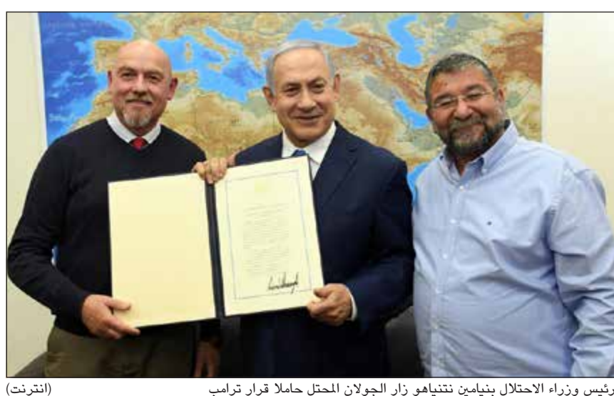
رئيس وزراء الاحتلال بنيامين نتنياهو زار الجولان المحتل حاملاً قرار ترامب

دفاعنا الجوي لعدوان جوي إسرائيلي استهدف بعض المواقع في المنطقة الصناعية في الشيخ نجار شمال شرق حلب، وأسقطت عدداً من الصواريخ المعادية»، موضحاً أن الأضرار «اقتصرت على الماديات». ونفت المصادر الرسمية وقوع قتلى لكن المرصد السوري لحقوق الإنسان، أفاد بأن الغارات استهدفت مخازن ذخيرة إيرانية وتسببت في مقتل 7 مقاتلين موالين لها من غير السوريين، في حصيلة جديدة أوردها أمس، كما أكد إصابة 5 مقاتلين سوريين بجروح.