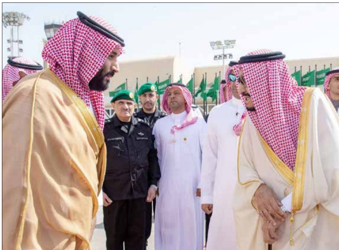
خادم الحرمين الشريفين الملك سلمان بن عبدالعزيز مغادراً إلى تونس أمس وداعاً صاحب السمو الملكي الأمير محمد بن سلمان

المعرضة على المجلس ولم يتم تأجيل أي مشروع وكان هناك تعديلات طفيفة على بعض القرارات.