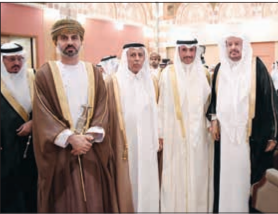
الغانم متوسلاً رؤساء الوفود

أجمعين معالي الأخ العزيز أبناء شعوبنا الخليجية، وهو حديث يؤكّد المؤكّد، ويعرف المعروف، لكننا لا يجب علينا أن ننسى أن كياننا الخليجي مهم بالنسبة للأخريين أيضا، للعرب، للمسلمين، وللعلم بأسره». وقال: «علينا ألا ننسى أن تضامننا الخليجي ووحدة موقفنا، لطلما كان دعامة للعمل العربي، وسندا للقضايا العربية، وسندا للقضايا السياسية وتنسيق الجيوب، كانت دائما السبابة في ردف التعاون والتضامن العربي، ودعم النشاط العربي ماديا ومعنويا».