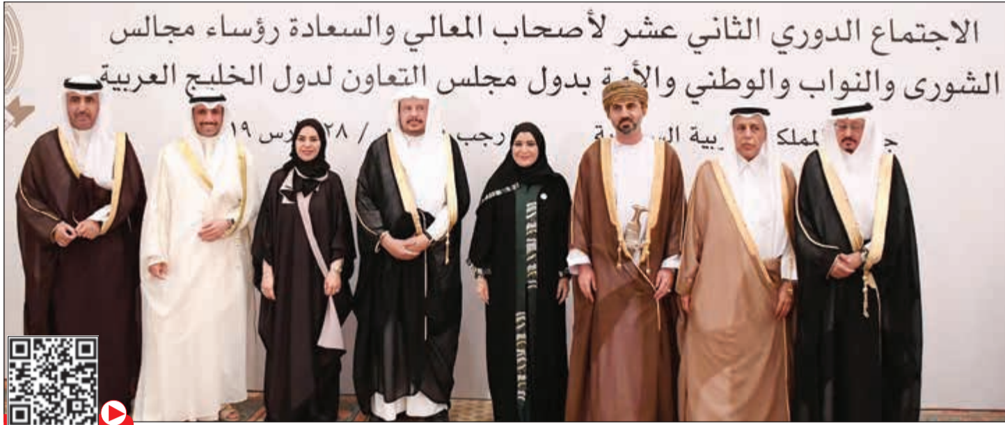
الرئيس مرزوق الغانم متوسلاً رؤساء وفود دول مجلس التعاون الخليجي