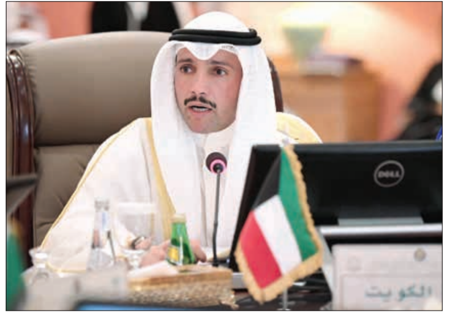
رئيس مجلس الأمة مرزوق الغانم متحدثاً

نحن في الكويت أميرا وبرلمانا وحكومة وشعبا نؤمن بالخليج نراهن على الخليج نشق بالخليج ونتكى على الخليج وندافع عن الخليج ونتطلع دوما إلى الخليج هذه ليست عاطفة بل هي عقيدة سياسية، وقد استراتيجي ووفقا لهذا الإيمان نعمل، وطبقا لهذه القناعة نسعى، واتباعا لهذا الاعتقاد نسير، لقد كان الخليج بأسره معنا عندما احتجنا إليه ونحن معه اليوم لأنه يحتاج إلينا.