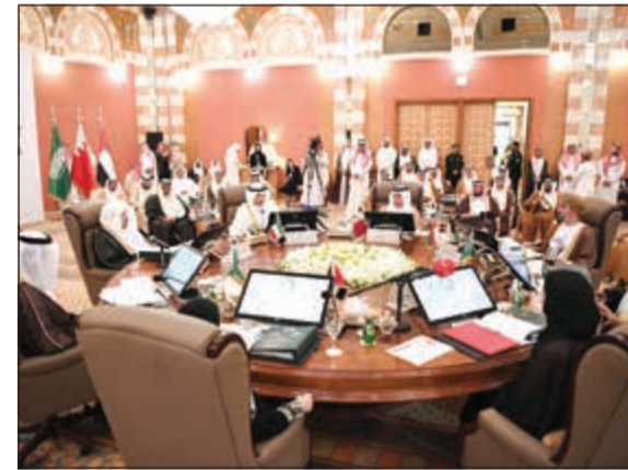
جانب من الاجتماع التشاوري لرؤساء الوفود

وأعرف ما الذي جرى، شعوبنا الخليجية تعرف ما الذي جرى، لكن هذا الوعي لن يكون بوابنا الى اليأس والقنوط، وممارسة الظلم السياسي وشق الجيوب، بل العكس تماما، هو وعي، يفترض وضع ما حدث في إطراره، دون التقليل منه من جهة، أو تحميله أكثر مما يحتمل من جهة أخرى. ومن يقول: «لا مشكلة لدينا هو الحال»، ومن يقول إن لدينا مشكلة «لكن لا حل لها هو الواهم»، وأنا لست حالما ولست مشكلة، وهناك حتما حل لها، وما بين المشكلة والحل، عمل دؤوب تقوم به كل الأطراف، وأنا أعني ما أقول، كل الأطراف، الخليجية بلا استثناء، تعمل بشكل وبتأخر على المضي في طريق الحل. وهو قريب ونراه رؤيا العين ونكاد نلمسه لمس اليد هي مسألة وقت، لأن إرادة الحل متاحة ونوابيا الخير متوافرة وصدق السراير موجود ومنجز إن اجتمعنا اليوم إشارة من إشارات الحل وتنسيقنا الدائم جزء من الحل والقارية والدولية، مؤونتنا والأخوة الحضور..