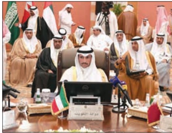
الرئيس مرزوق الغانم مترسلاً وفد الكويت