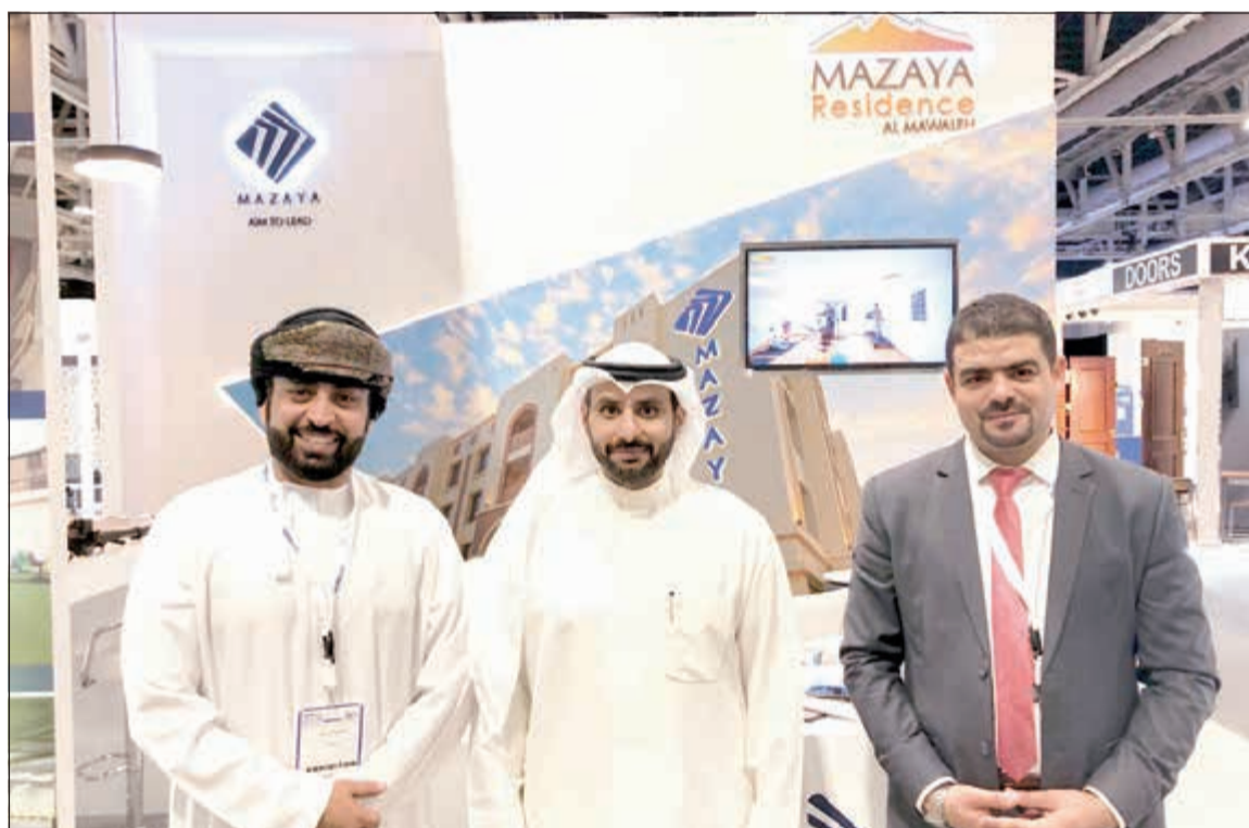
الشيخ مبارك الصباح في لحظة جماعية بجناح الشركة

أعلنت شركة المزايا القابضة في بيان صحفي أمس عن مشاركتها في معرض عمان العقاري (أوريكس)، بمرکز عمان للمؤتمرات والمعارض والذي يعد المنصة الأهم في السلطنة لعرض العقارات المحلية والعالمية ويستمر على مدار 3 أيام خلال الفترة من 25 ولغاية 27 مارس 2019، حيث تهدف المزايا إلى مواصلة تسويق مشروعاتها المتميز في سلطنة عمان «مزايا ريزيدانس الموالح»، والذي تم الانتهاء من مرحلته الأولى وتسليمها العام الماضي.