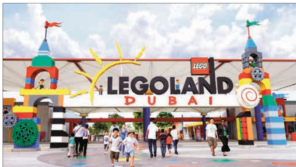
المدن الترفيهية بدبي توفر المتعة والأثارة للكبار والصغار