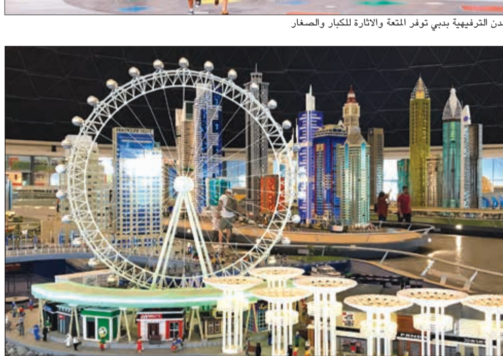
مدينة ليجو لاند معلم ترفيهي وتثقيفي مميز

واقعي إلى سحر تلك الأجواء. وتضم مدينة ملاهي موشن جيت دبي ألعاباً ومعالم مستوحاة من أهم وأنتج الأفلام التي تم تصويرها في هوليوود خلال السنوات الأخيرة من إبداع الاستوديوهات العالمية مثل: كولومبيا بيكتشرز، وديم ووركس أنيميشن، وليونزجيت إلى معالم شيقة متمثلة أمامك. وبجانب الاستمتاع بمشاهدة الشخصيات الكرتونية المحبوبة ك«السنافر» و«شريك» و«إبطال فيلم «هونغ كونغ» على ألعاب