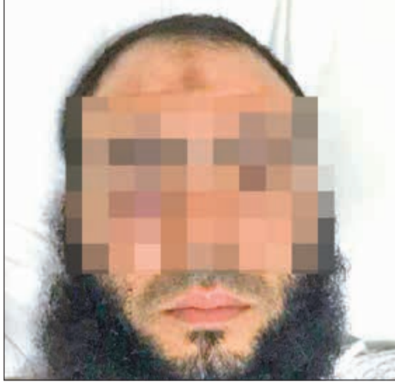
المصري المتهم بالانضمام لتنظيم «داعش»

أصدرت محكمة الاستئناف أمس حكماً بقضية المصري المتهم بالانضمام إلى تنظيم «داعش»، ودهس عدد من الأميركيين في ضاحية عبدالله المبارك، حيث قضت بتأييد حكم محكمة الجنابات بحبسه حبساً مؤبداً. وكانت الأجهزة الأمنية قد ألقت القبض على المتهم بعدما قام خلال أكتوبر العام قبل الماضي عمداً بالاصطدام بمركبة الأميركية بآلية ثقيلة تخص شركة المقاولات التي يعمل بها قاصداً قتلهم، ما أصابهم بجروح خطيرة، وقد عُثر رجال الأمن داخل الآلية التي يقودها على حزام ناسف ومواد تدخل في صناعة المتفجرات. وكشفت التحقيقات التي أجريت معه على انضمامه واقتناعه بأفكار التنظيم المتشدد «داعش».