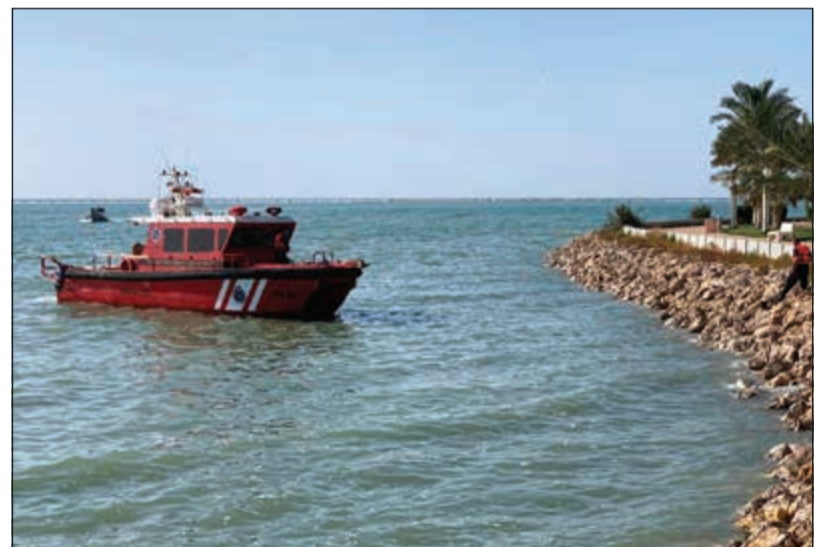
آليات الإطفاء تمشط مكان غرق الوافد قبل العثور على الجثة