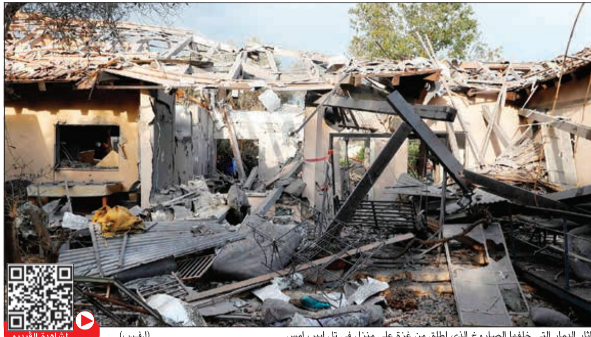
أثار الدمار التي خلفها الصاروخ الذي أطلق من غزة على منزل في تل أبيب أمس (أ.ف.ب)

في «حماس» اتهام إسرائيل بأن الحركة تقف وراء إطلاق الصاروخ، وقال: «لا أحد من حركات المقاومة، بما في ذلك حماس، مهتم بإطلاق صواريخ من قطاع غزة باتجاه العدو». سلمت إلى مصر التي تصرفت كوسيط بين إسرائيل وحماس. كما حذرت كتائب المقاومة الوطنية الجناح العسكري للجبهة الديمقراطية لتحرير فلسطين، الاحتلال من الإقدام على ارتكاب أي «حماسة» أو عدوان يستهدف الشعب ومقاومته، وشددت على أن الرد سيكون قاسياً في حال تبادى الاحتلال وصعد من عدوانه على الشعب ومقاومته. وأضافت أن الاحتلال يعي جيداً قدرة المقاومة على فرض مبادئها بالرد على حماقاته وعدوانه المتكرر على الشعب، وهذا ما أثبتته المقاومة خلال جولات التصعيد العسكري السابقة مع الاحتلال. بدورها، حذرت حركة الجهاد الإسلامي على لسان أمينها العام زياد النخالة «العدو الصهيوني، من ارتكاب