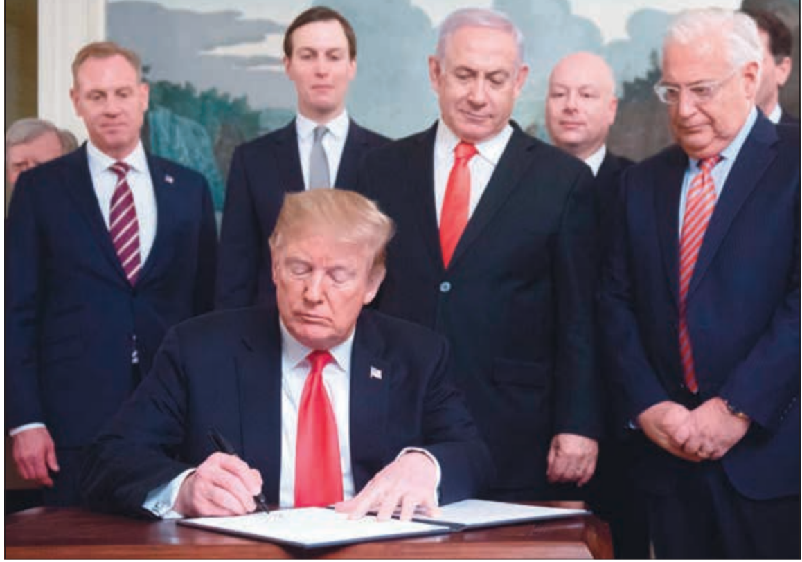
الرئيس الأميركي دونالد ترامب يوقع على قرار بسيادة إسرائيل على الجولان المحتلة أمس

وشدد على أنه «يمثل أعلى درجات الإذراء للشرعية الدولية، وصفعة مهينة للمجتمع الدولي». وتابع: «ويفقد الأمم المتحدة مكانتها ومصداقيتها، من خلال الانتهاك الأميركي المسافر لقراراتها بخصوص الجولان السوري المحتل، وخاصة القرار 497 لعام 1981، الذي يؤكد الوضع القانوني للجولان السوري كأرض محتلة، ويرفض قرار الضم لكيان الاحتلال الإسرائيلي (1981)، ويعتبره باطلاً ولا اثر قانونياً له».