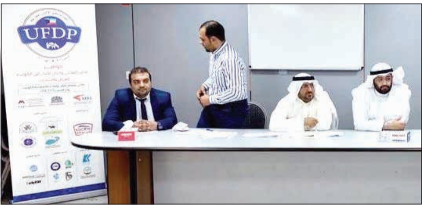
جانب من العمومية

عقد اتحاد منتجي الألبان المتازجة جمعيتها العمومية أمس الأول بمقر الاتحاد بالصليبية الزراعية، حيث تمت تركية مجلس الإدارة السابق لفترة جديدة. وقال الاتحاد في بيان صحافي إنه بعد اكتمال النصاب القانوني للجمعية العمومية تمت تركية مجلس إدارة لفترة جديدة، والذي جاء كالتالي: