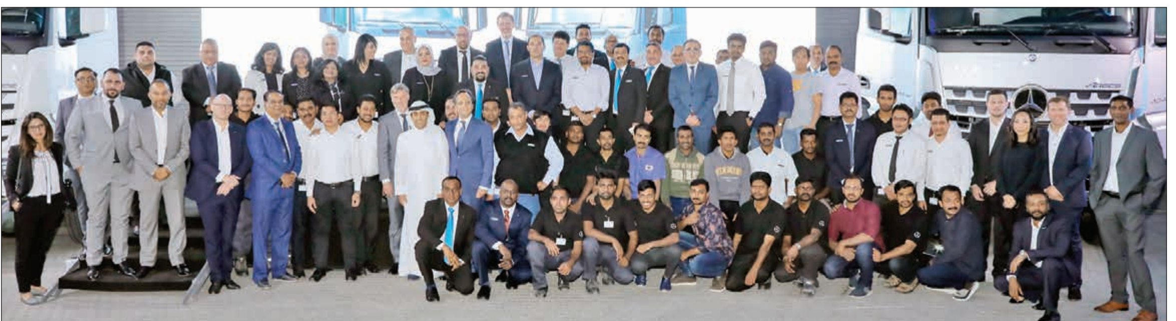
فريق مرسيدس بنز المركبات التجارية