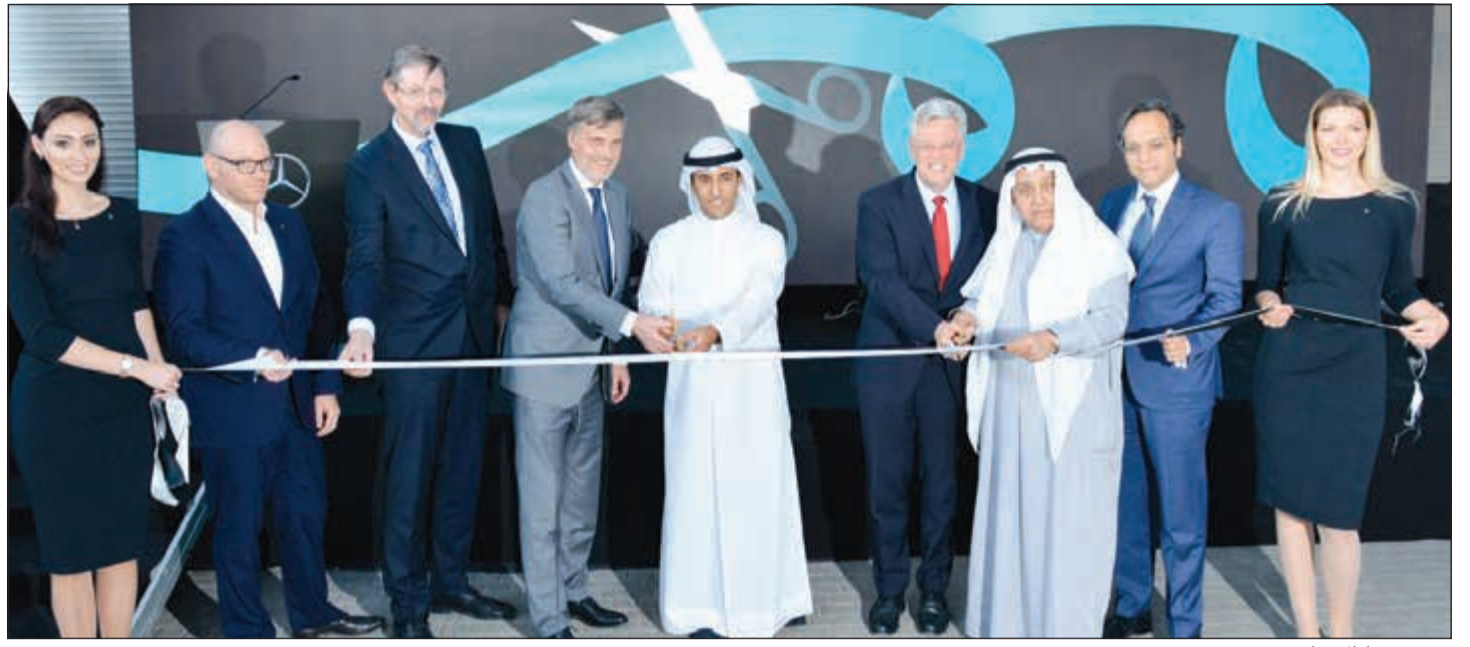
قص شريط الافتتاح