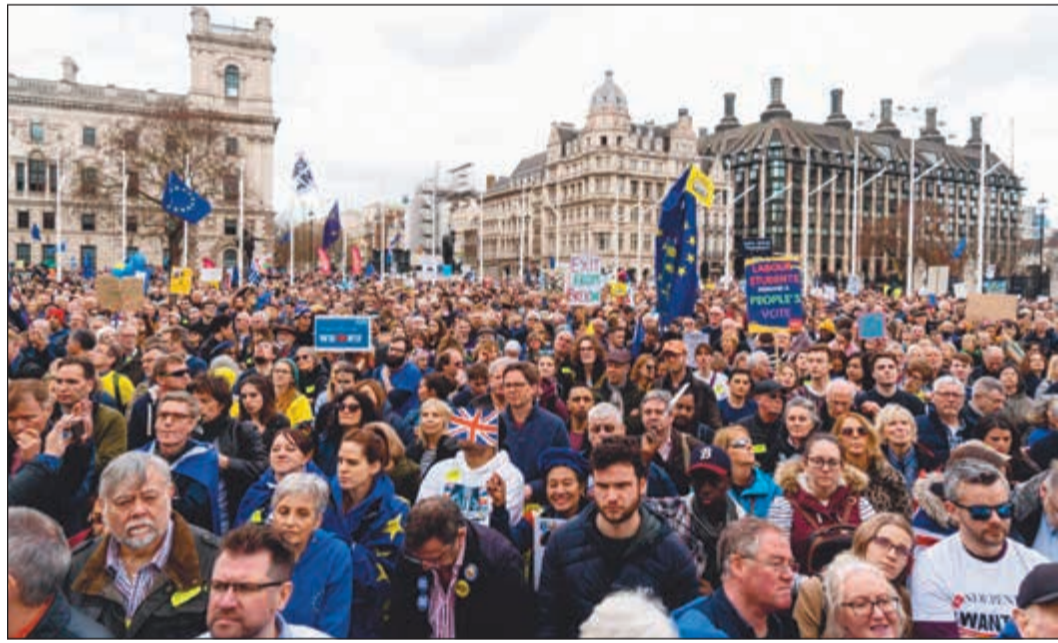
مظاهرة مليونية في لندن للمطالبة باستفتاء ثان على «بريكست»، امس

لندن - وكالات: نزل مئات آلاف الأشخاص إلى الشوارع في لندن امس مطالبين باستفتاء جديد حول «بريكست» وسط أجواء تشكك في تمكن رئيسة الحكومة البريطانية تيريزا ماي مجدداً من عرض اتفاقها مع الاتحاد الأوروبي على مجلس العموم ونزاييد الضغوط عليها لتقديم استقالتها. وحمل المتظاهرون لافتات كتب على بعضها «أحب الاتحاد الأوروبي»، و«نطالب بتصويت شعبي»، و«الخروج من الاتحاد الأوروبي لن ينجح». وسارت الحشود في وسط العاصمة لندن على مسافة غير بعيدة من مكاتب تيريزا ماي، وسط هتافات مناهضة لبريكست وبحر من الإعلام الأوروبية. ونالت تيريزا ماي نصيبها من الانتقادات، فتعددت الرسوم الكاريكاتورية التي تظهرها مسؤولة عاجزة وقد تجاوزتها الأحداث. وقدرت منظمة «بيبولز فوت» التي تقوم بحملة لإجراء استفتاء جديد، عدد المشاركين في التظاهرة بنحو مليون، في حين لم تقدم شرطة سكتلنديارد أي رقم. وجاءت هذه المسيرة بعد يومين على قرار القادة الأوروبيين بالموافقة على ارجاء بريكست الى ما بعد الموعد