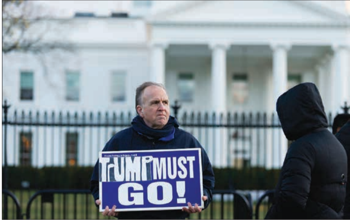
محتج يرفع لافتة أمام البيت الأبيض تطالب ترامب بالرحيل عقب صدور تقرير مولر امس الاول

واشنطن - وكالات: قدم المحقق الخاص روبرت مولر تقريره الذي طال انتظاره إثر تحقيقات استمرت طيلة عامين حول التدخل الروسي المفترض في الانتخابات الرئاسية عام 2016، دون أن يتضمن إدانة للرئيس دونالد ترامب أو التوصية بذلك.