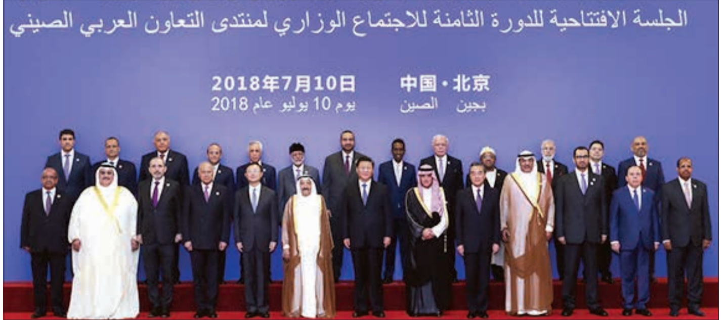
صاحب السمو الأمير الشيخ صباح الأحمد والرئيس الصيني خلال الدورة الثامنة للاجتماع الوزاري لمنتدى التعاون العربي الصيني

ظل البلدان يتبادلان التفهم والدعم في القضايا المتعلقة بالهموم الرئيسية، وظلت الكويت صديقا محيما موثوقا به وشريكا جيدا في تعاون صادق. لن ينسى الشعب الصيني أبدا دعم الكويت القيم للصين في استعادة مقعدها الشرعي في الأمم المتحدة، ولن ينسى موقفها الثابت المتمثل في التزامها بمبدأ الصين الواحدة، ولا معونة الكويت الكريمة للصين