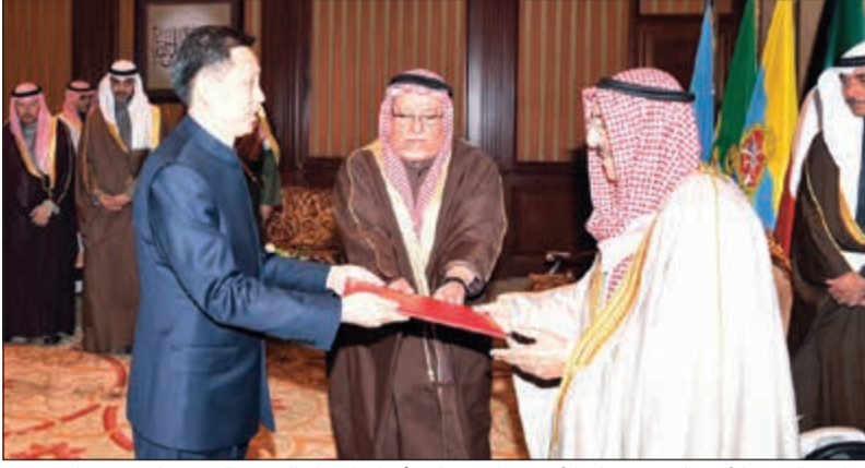
صاحب السمو الأمير الشيخ صباح الأحمد خلال تسلمه أوراق اعتماد السفير الصيني لي مينغ قانع