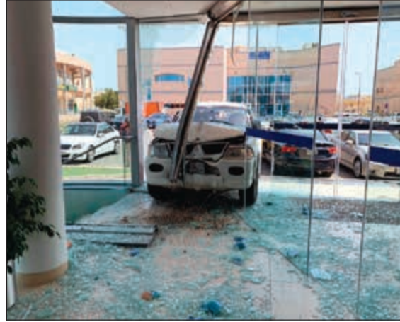
المركبة انطلقت للامام لتحمط واجهة البنك