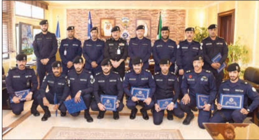
اللواء جمال الصايغ يتوسط مكرمي المرور والعمليات

وزير الداخلية الشيخ خالد الجراح ومتابعة وكيل وزارة الداخلية الفريق عصام النهام، تم تكريم عدد من الضباط وضباط الصف وأفراد من قطاعي المرور والعمليات وذلك لجهودهم المتميزة ونشاطهم في أداء عملهم.