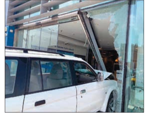
زجاج البنك احتضن مقدمة المركبة

غير المتعمد. وقال مصدر أمني ان رجال الأمن انتقلوا عقب تلقي بلاغ بالحادث لمعاينة موقعه. وتبين ان مركبة اخطأ قائدها وبدلا من ان يضع ناقل الحركة على حرف الـ «R»، أي وضعية الرجوع للخلف قام