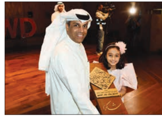
درع تكريمية للوزير الفاضل

وشكر الفاضل اللجنة المنظمة والمعدة لبرنامج اليوم العالمي للمياه، والجهات التي تعاونت وشاركت في هذه الفعالية، ومركز الشيخ جابر الأحمد