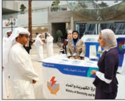
د.خالد الفاضل يستمع لشرح حول الخدمات الجديدة

في عملية دفع الفواتير وإنجاز معاملات الوزارة، لافتاً إلى أن بعض الخدمات كانت موجودة على أنظمة الوزارة وتم تطويرها، لتقليل مدة تلك الخدمات، لافتاً إلى أن تلك الخدمات تم إطلاقها في شهر فبراير لتجربتها، والتأكد من سلامتها وسلامة الإجراءات والعمليات التي يتم تنفيذها عبر تلك الألية الإلكترونية. وقال إن التواصل مع المستهلكين في مجمع الأفتيون يساهم في