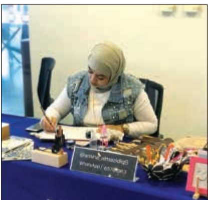
جانب من المشاركات في الاحتفال