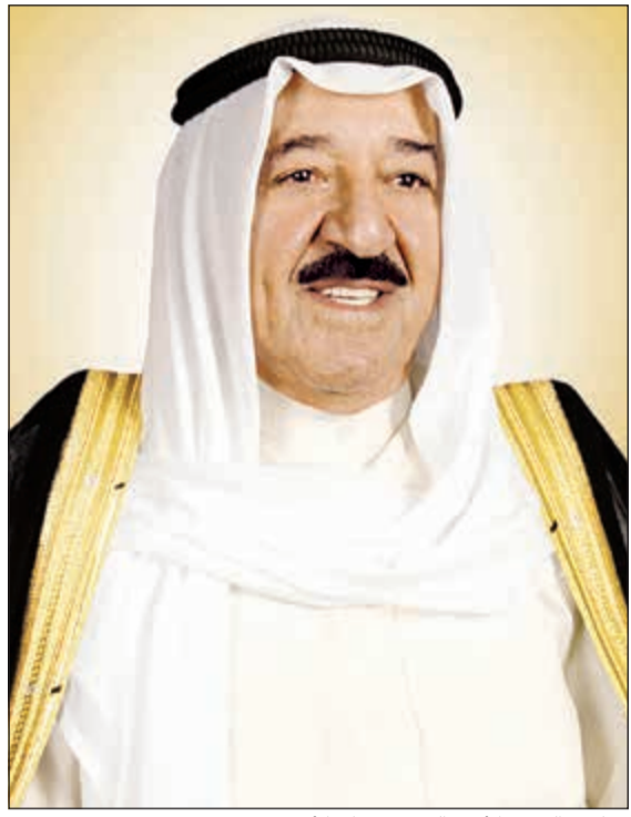
صاحب السمو الأمير الشيخ صباح الأحمد