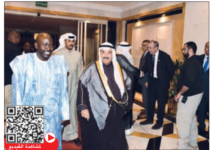
سمو الشيخ ناصر محمد يقدم التهانى للسفير السنغالي عبدالأحد امباكي (محمد هندراوي)