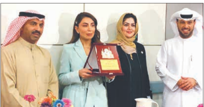
تكريم الإعلامية حصة البناي بحضور الفنان طارق العلي

بالشكر لإدارة المستشفى على الجهد المبذول، وكذلك الشركات الداعمة وجمعيات النفع العام والفرق التطوعية والفنانين والإعلاميين على حضورهم لدعم مرضى السرطان، من جانبها، قدمت مدير مركز الكويت للسرطان الشكر لكل المشاركين في الاحتفال بعيد الأسرة لحرصهم على الدعم المعنوي للمرضى. من جانبها، قام الفنان طارق العلي بجولة في أجنحة المستشفى، لعبادة المرضى وتقديم الدعم المعنوي لهم، من جانبها أعربت الإعلامية حصة البناي عن سعادتها بالتواصل مع المرضى وجلب السعادة لهم، وكذلك موافقة الزيارة لعيد الأم، حيث قامت بزيارة أجنحة النساء وقدمت الزهور للمريضات وتمنت لهن الشفاء العاجل.