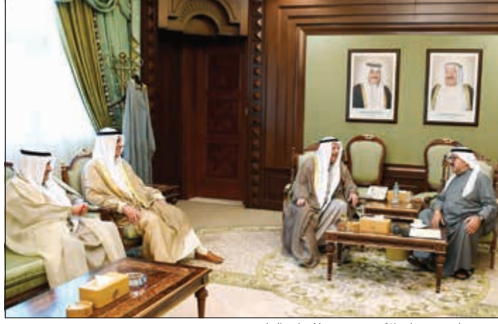
الشيخ ناصر صباح الأحمد مستقبلاً علي الغانم