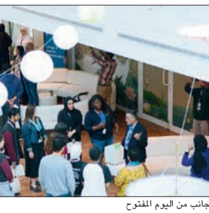
جانب من اليوم المفتوح

تم قاموا بجولة تعرفوا من خلالها على مرافق الحرم الجامعي. كما تضمنت الجولة زيارة مكتبة عبدالله الرفاعي، وعلى قسم الفنون والموسيقى، واستديوهات الإذاعة والتلفزيون، وصالة الألعاب والمسرح ومركز المؤتمرات الخاص بها. كما التقى الطلبة بمجموعة من موظفي وأعضاء هيئة تدريس الجامعة من كلية إدارة الأعمال، وكلية الآداب والعلوم، ومركز حياة الطالب، ومركز ساعد، وقسم النشاط الرياضي، وقسم القبول والتسجيل وتمكن الطلبة من الحصول على أجوبة لاستفساراتهم العديدة والمتعلقة بالجامعة والدراسة الأكاديمية.