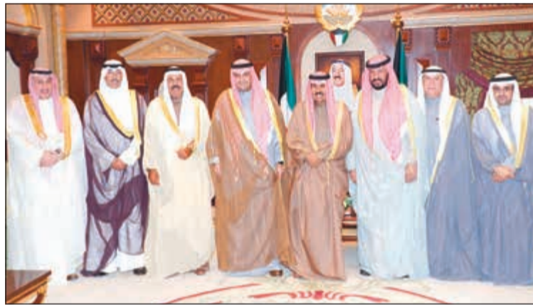
سمو ولي العهد الشيخ نواف الاحمد خلال استقباله انس الصالح والمحافظين