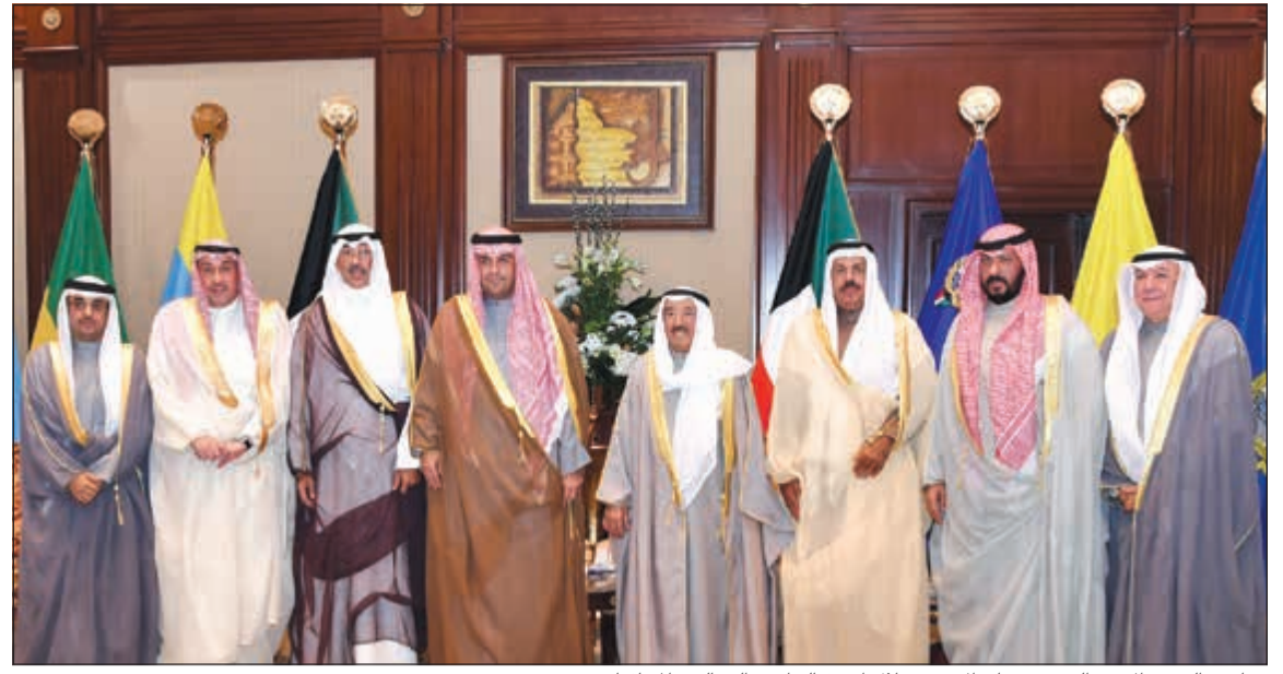
صاحب السمو الامير الشيخ صباح الاحمد خلال استقباله انس الصالح والمحافظين