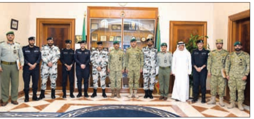
اللواء الركن فالح شجاع خلال الاجتماع مع ممثلي وزارة الداخلية

يخص اعمال مكافحة الإرهاب ورفع مستوى الجاهزية القتالية لقوات الحرس الوطني في البلديين الشقيقين. ويأتي هذا التمرين تنفيذًا للبروتوكول الموقع بين رئاسة الحرس الوطني بململكة البحرين والرئاسة العامة للحرس الوطني الكويتي. إلى ذلك، عقد المعاون للعمليات والتدريب في الحرس الوطني اللواء الركن فالح شجاع لبحث التنسيق حول كيفية تلقي البلاغات في المنشآت النفطية في المنطقة الوسطى التي تولى الحرس الوطني تأمينها مؤخرا. وقال اللواء الركن فالح شجاع إن الاجتماع تناول الاستفادة من خبرات وزارة الداخلية ومعرفة الإجراءات الصحيحة والمتبعة في حال ورود بلاغات أو حدوث حالات طوارئ في المنطقة الوسطى، بهدف تحقيق التكامل مع المؤسسات الأمنية في البلاد، وفق ما أقرته الوثيقة الاستراتيجية للحرس الوطني 2020 (الأمن أولاً).