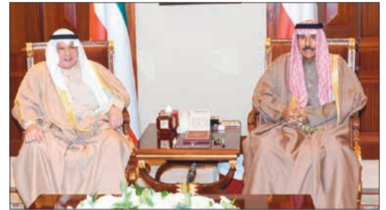
سمو ولي العهد الشيخ نواف الاحمد خلال استقباله الشيخ خالد الجراح

دورا كبيرا في الإشراف على تنفيذ سياسة الدولة ومتابعة مشروعات خطة التنمية في إطار محافظته، مشيرا إلى ضرورة التنسيق مع مختلف الجهات الحكومية لتحقيق النهضة المنشودة والوقوف على حاجات المواطنين والتماس مطالبهم. حضر المقابلة رئيس ديوان رئيس مجلس الوزراء الشيخة اعتماد الخالد. كما استقبل سمو رئيس مجلس الوزراء الشيخ جابر المبارك وبحضور وزير النفط ووزير الكهرباء والماء داخل الفاصل وزير الكهرباء جمهورية العراق د.لؤي حميد جواد الخطيب والوفد المرافق له وذلك بمناسبة زيارته للبلاد.