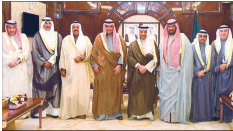
سمو رئيس الوزراء الشيخ جابر المبارك خلال استقباله انس الصالح والمحافظين

ولي العهد: ضرورة تلمس احتياجات المحافظات والمواطنين وتحسين جودة الخدمات ■ رئيس الوزراء: للمحافظ دور كبير في الإشراف على تنفيذ سياسة الدولة ومتابعة مشروعات خطة التنمية