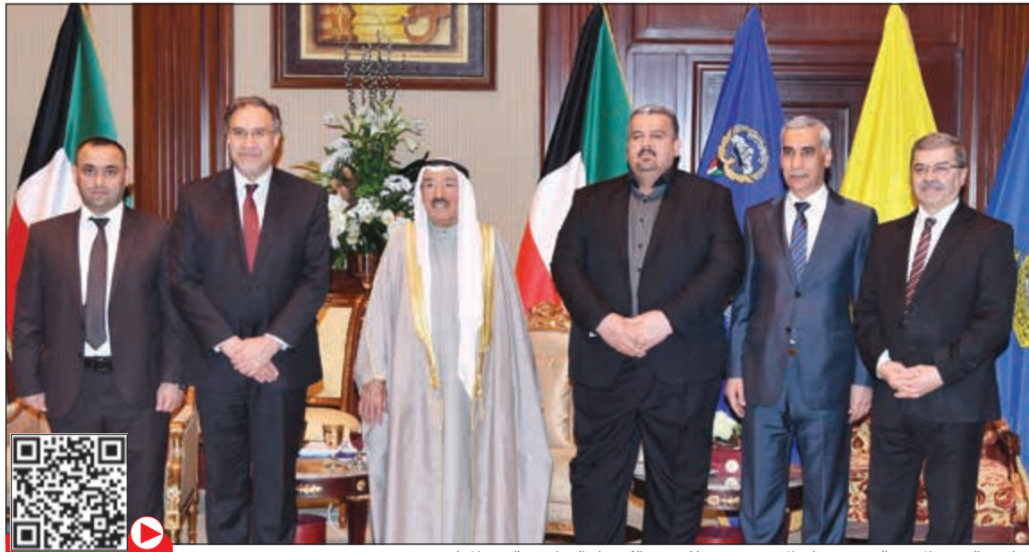
صاحب السمو الامير الشيخ صباح الاحمد مستقبلا وزير الكهرباء العراقي والوفد المرافق