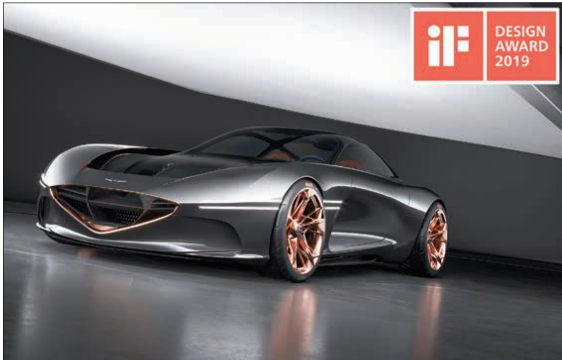
جينيسيس إسينشا النموذجية

إسينشا أول سيارة كهربائية تعمل بالبطارية في العلامة التجارية