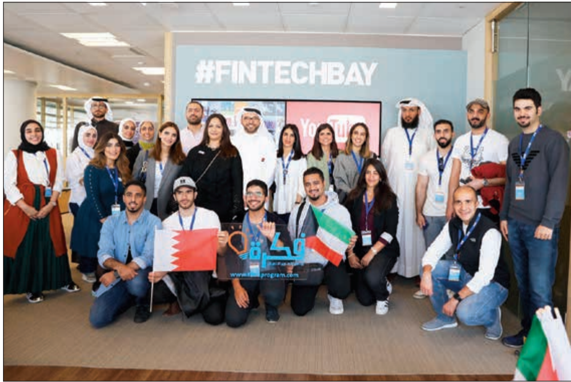
صورة جماعية للمشاركين في الفعالية