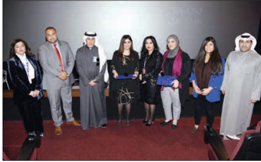
صورة جماعية للموظفين المكرمين

كما تستمر إدارة شؤون العملاء في إيجاد مبادرات تحفيزية لتشجيع الموظفين وتطوير أدائهم وتعزيز الالتزام نحو أهداف البنك وسياساته المصرفية في تواصله مع عملائه.