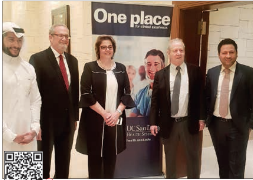
السفير الأميركي لورانس سيلفرمان ود.لورانس فريدمان ونور الدين شحادة ود.ندى سهيل ونائب السنتلي خلال الفعاليات

حضور السفير الأميركي لدى الكويت لورانس سيلفرمان نظمت جامعة كاليفورنيا سان دييغو للعلوم الصحية ندوة للتعرف على آخر تطورات الخدمات المقدمة من قبل المستشفى الجامعي بالتعاون مع المكتب التجاري لسفارة الولايات المتحدة لدى البلاد وذلك مساء امس الاول في فندق الجيميرا بحضور مساعدة وزير الخارجية للشؤون التعليمية والثقافية ماري رويس والرئيس التنفيذي لخدمات المرضى الدوليين ونائب عميد الجامعة للشؤون السريرية د.لورانس فريدمان، والأخصائي التجاري بالسفارة يوسف المهدي ومدير تطوير الأعمال في الشرق الأوسط بالجامعة نور الدين شحادة، ومدير إدارة العلاج بالخارج في وزارة الصحة د.فؤاد القطان. في البداية، قال السفير الأميركي لورانس سيلفرمان: شيء عظيم أن أكون هنا في هذا المؤتمر الطبي وشكراً جزئياً. للسكرتيرة التي حضرت إلى الكويت للمشاركة في الحوار الاستراتيجي بين أميركا والكويت، ونحن نضع الرعاية الصحية في مقدمة الأولويات في العلاقات بين البلدين، ونحن هنا لتشجيع وتعزيز العلاقة بين المؤسسات الصحية في البلدين، ونريد تشجيع البحث، سمعت من العديد من الأطباء عند كلا الجانبين