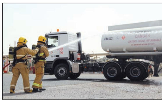
جانب من التمرين الوهمي في مطار الكويت الدولي

وتضمن سيناريو التمرين تصادم ناقلتين أسفر عن حريق في ناقلة وقود طائرات وإصابة سائق الأخرى بمحطة التعبئة، وقد تم التعامل معه باستخدام معدات مكافحة الحريق والأجهزة المطورة، كما قامت الطوارئ الطبية بإسعاف المصاب وتم تأمين الموقع من قبل رجال امن