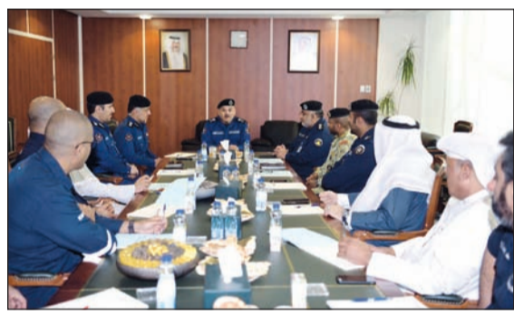
الواء جمال البليهيس يترأس اجتماعا لممثلي الجهات المشاركة في «شامل 5»

على التعامل مع أي حدث طارئ. جاء ذلك في الاجتماع الذي عقدته الجهات المشاركة في التمرين أمس الاثنين بمبنى الإدارة العامة للإطفاء بحضور رئيس فريق تمرين شامل العقيد معاذ الحمادي وذلك للوقوف على مرحلة التنفيذ الميداني التي تم الملاحظات والإيجابيات التي برزت في التمرين مع وضع السبل الرامية لتعزيز دور كل جهة مشاركة في حالات الطوارئ تمهيدا لرفع مذكرة نهائية للقيادة العليا.