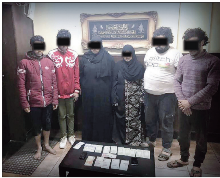
المتهمون بعد القبض عليهم وأمامهم المسروقات