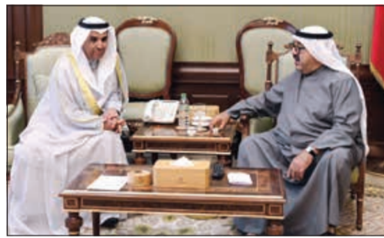
الشيخ ناصر صباح الأحمد مستقبلاً سفيرنا لدى التشيك

التقى القائم بأعمال مساعد وزير الخارجية الأميركي لشؤون الشرق الأدنى