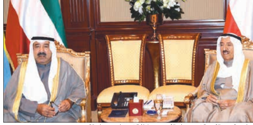
صاحب السمو الأمير الشيخ صباح الأحمد مستقبلاً الشيخ ناصر صباح الأحمد

الشيخ نواف الأحمد المبارك ببرقية تعزية مماثلة. التي ذلك، بعث صاحب السمو الأمير الشيخ صباح الأحمد ببرقية تعزية إلى الرئيس فليكس تشيسكيدي رئيس جمهورية الكونغو الديموقراطية الصديقة فيها سموه عن خالص تعازيه بضحايا حادث خروج قطار إقليم بلوشستان جنوب غرب باكستان والذي أسفر عن سقوط عدد من الضحايا والمصابين، سائلاً سموه المولى تعالى أن يتغمد الضحايا بواسع رحمته ومغفرته ويمن على المصابين بالشفاء العاجل. كما بعث سمو رئيس مجلس الوزراء الشيخ جابر المبارك ببرقية تعزية مماثلة.