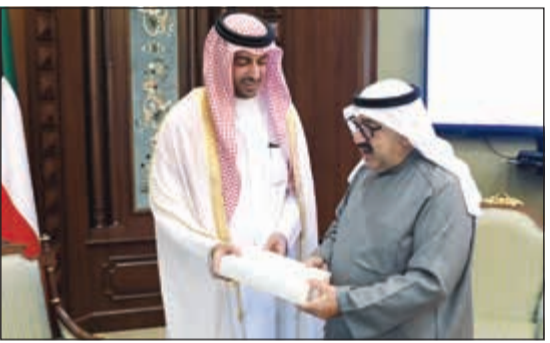
الشيخ ناصر صباح الأحمد مستقبلاً سفير قطر

كما استقبل النائب الأول لرئيس مجلس الوزراء ووزير الدفاع الشيخ ناصر صباح الأحمد وفد مؤسسة ومعهد دول الخليج العربية في واشنطن، بمناسبة زيارتهم للبلاد.