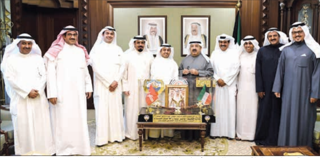
الشيخ ناصر صباح الأحمد مستقبلاً رئيس وأعضاء مجلس إدارة الاتحاد الكويتي للمزارعين