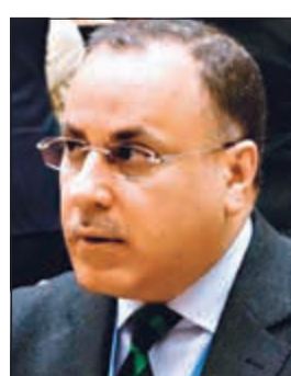
السفير جمال الغنيم

باقتحام ساحة المسجد الأقصى». وأضاف ان «الكويت تنتظر باستغراب للصمت الدولي حيال سياسات اسرائيل في توقيف الحوافر السياسية والاقتصادية من أجل تشجيع سكانها على الاستيطان غير القانوني في الأراضي المحتلة سعياً منها إلى تعزيز الاحتلال وتغيير صفتها الجغرافية والديمقراطية». وأكد السفير الكويتي ان استمرار اسرائيل في تهويد مدينة القدس وتغيير معالمها الدينية والتاريخية واستمرار أعمال الحفريات والتقيب