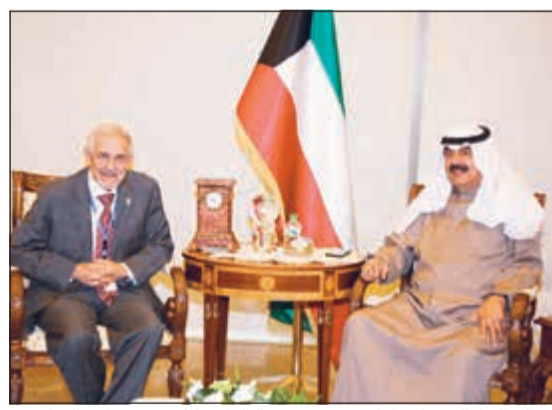
خالد الجارالله خلال لقائه رئيس جمعية الهلال الأحمر د. هلال السائر

للبلاد والوفد المرافق له وتم خلال اللقاء استعراض المواضيع الواردة على جدول أعمال الدورة الثالثة للحوار الاستراتيجي بين الكويت والولايات المتحدة الأميركية إضافة إلى تطورات الأوضاع على الساحتين الإقليمية والدولية. حضر اللقاء مساعد وزير الخارجية لشؤون مكتب نائب الوزير السفير أيهم العمر ومساعد وزير الخارجية لشؤون الأميركيين الوزير المفوض ريب الخالد وسفير الولايات المتحدة الأميركية لدى الكويت لورانيس سيلفرمان.