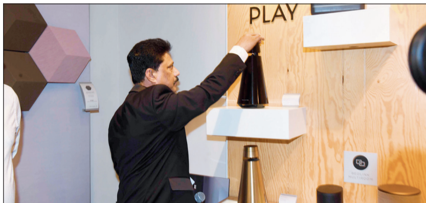
شرح تفصيلي للحضور عن المنتج الجديد

وقال العبد الجليل إن «آفاق» تقوم حاليا بتسليم الوثائق للملاك تزامنا مع إدارة البرج بالكامل من