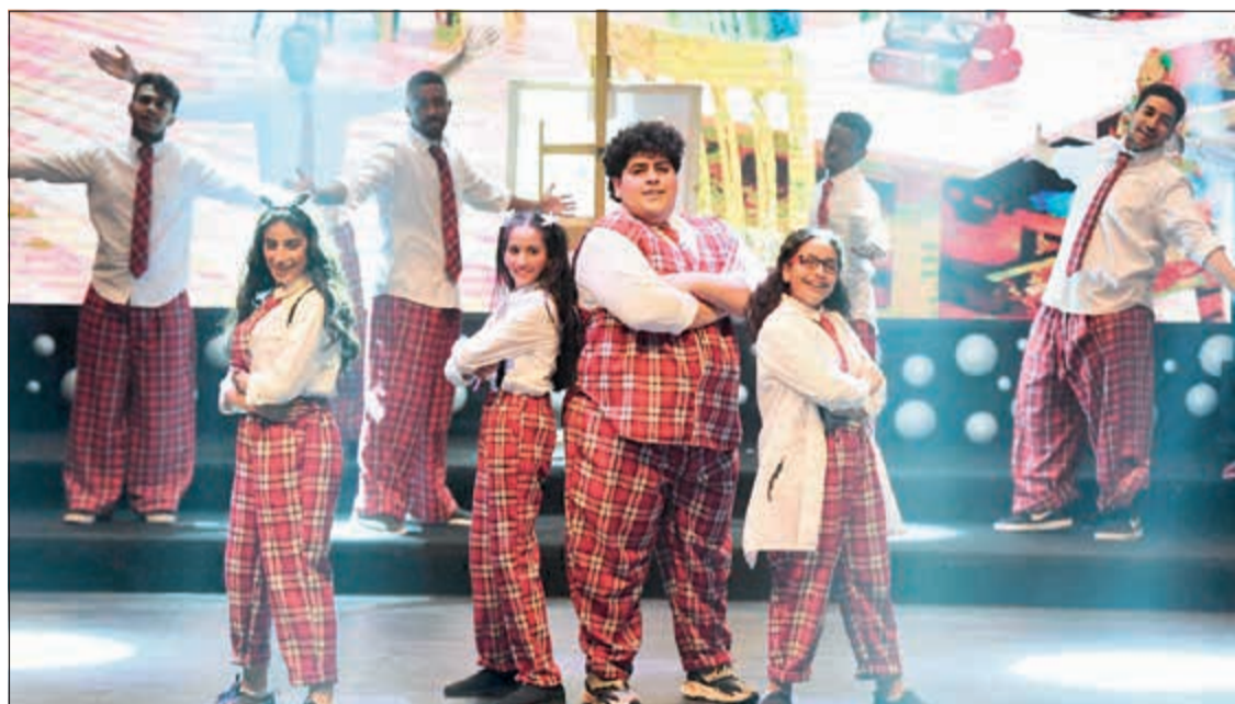
جانب من العرض المسرحي

يذكر أن مهرجان أجيال المستقبل تستمر فعالياته حتى 24 الجاري ويتضمن العديد من الفعاليات والورش والمحاضرات الخاصة بالطفل والناشئة.