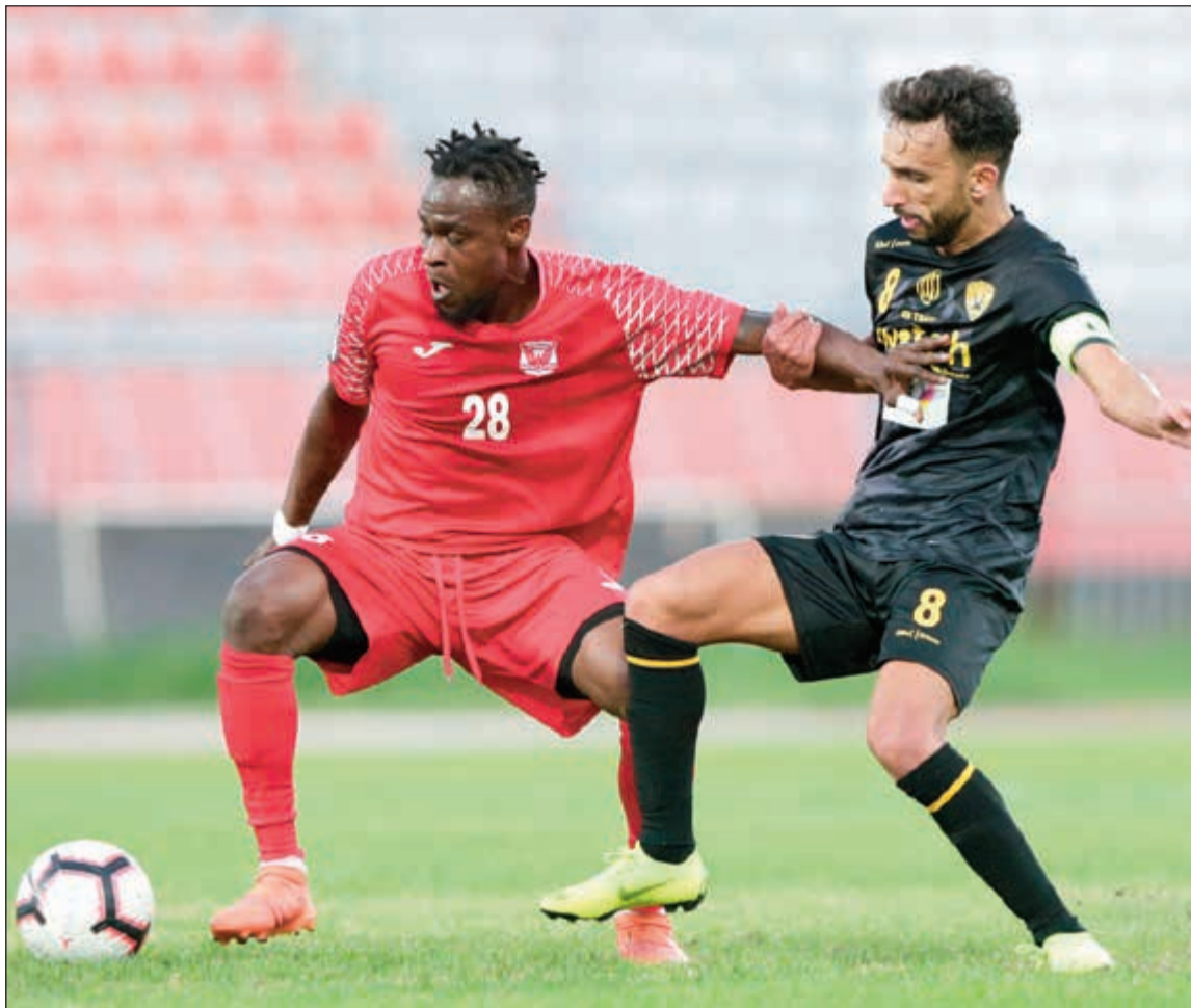
صراع من نوع خاص يشهده لقاء القادسية والفحيحيل غداً

في مباراة مؤجلة من الجولة 15 من دوري VIVA تقام غداً