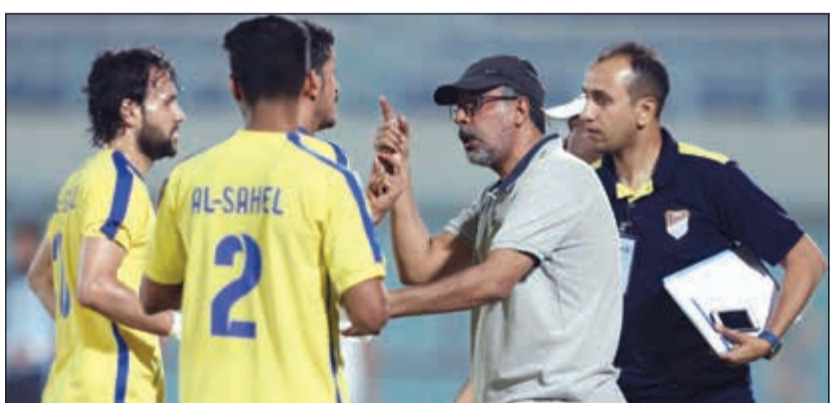
الساحل يستعد للسلمية بالمواجهات الودية