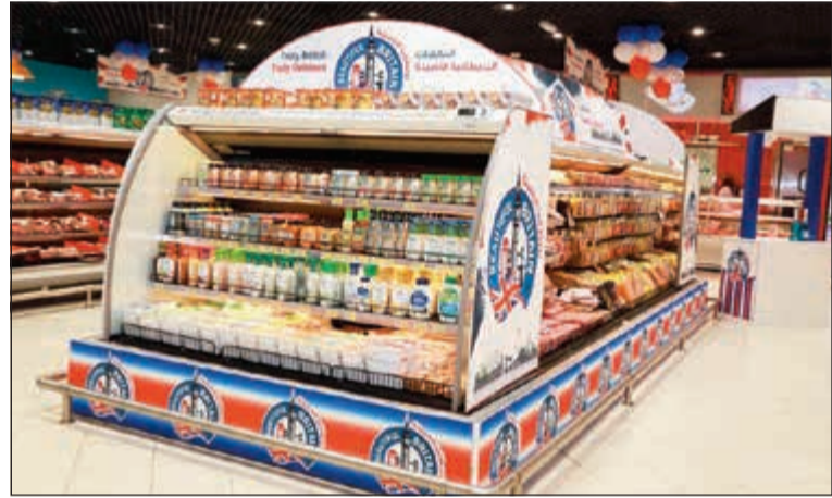
أفضل النكهات البريطانية الأصلية