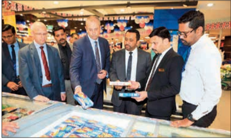
السفير مايكل دافنبورت مطلعاً على بعض المنتجات

أطلق لولو هايبر ماركت، الرائد في مجال تجارة التجزئة في المنطقة، عرضه الترويجي الذي طال انتظاره «أفضل ما في بريطانيا 2019» في 13 مارس في متجره بالعقيلة. وقد افتتح العرض الترويجي الذي يستمر على مدار 11 يوماً سفير المملكة المتحدة لدى الكويت مايكل دافنبورت بحضور الإدارة العليا للولو هايبر ماركت في الكويت وتجمع كبير من العملاء والموظفين والإعلاميين. يتوافق هذا العرض الترويجي، المقرر أن ينتهي في 23 مارس، في جميع متاجر لولو هايبر ماركت في الكويت التي أحبطت بأجواء التسوق البريطاني من خلال ديكورات لأشهر المعالم البريطانية الشهيرة والتي يتم عرضها بشكل بارز في جميع المتاجر.