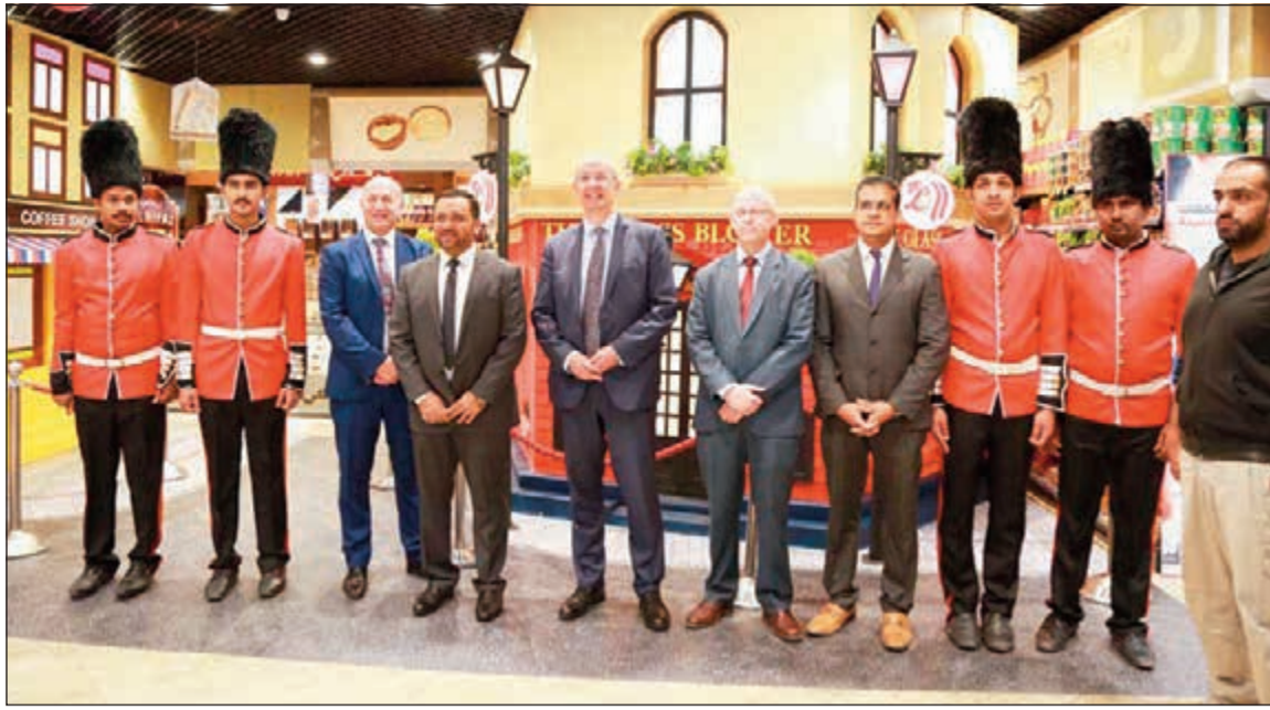
لقطة تذكارية مع السفير البريطاني مايكل دافنبورت خلال المهرجان (أحمد علي)