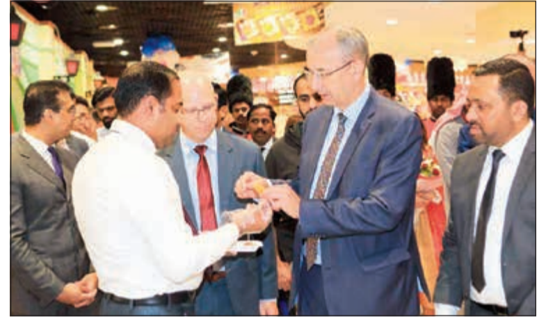
تجربة أحد المنتجات

أطلق لولو هايبر ماركت، الرائد في مجال تجارة التجزئة في المنطقة، عرضه الترويجي الذي طال انتظاره «أفضل ما في بريطانيا 2019» في 13 مارس في متجره بالعقيلة. وقد افتتح العرض الترويجي الذي يستمر على مدار 11 يوماً سفير المملكة المتحدة لدى الكويت مايكل دافنبورت بحضور الإدارة العليا للولو هايبر ماركت في الكويت وتجمع كبير من العملاء والموظفين والإعلاميين. يتوافق هذا العرض الترويجي، المقرر أن ينتهي في 23 مارس، في جميع متاجر لولو هايبر ماركت في الكويت التي أحبطت بأجواء التسوق البريطاني من خلال ديكورات لأشهر المعالم البريطانية الشهيرة والتي يتم عرضها بشكل بارز في جميع المتاجر.