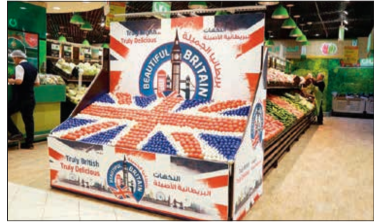
منتجات بريطانيا الجميلة في «لولو هايبر ماركت»