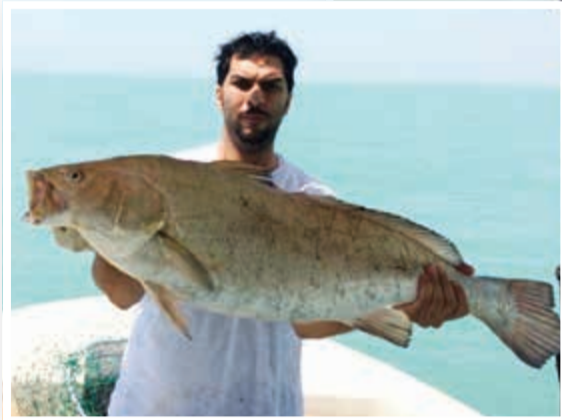
السيطي مزاجي و"ماله قلب على الزورية" و"الجنعدة" موجودة حتى أبريل