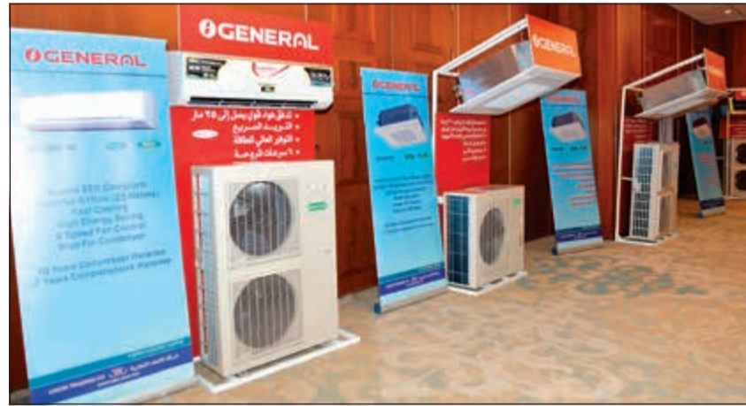
أفضل أجهزة التكييف من «الاتحاد التجارية»