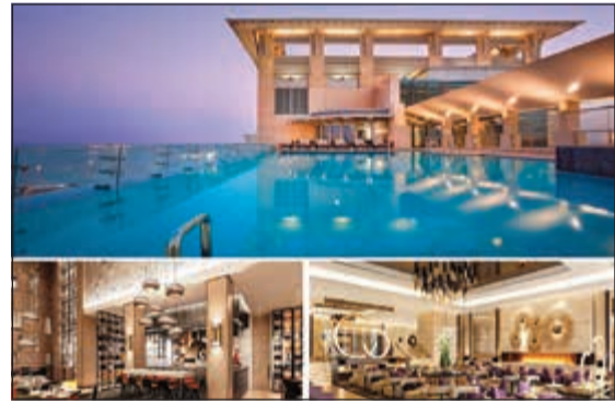
إطلالة مميزة لفندق حياة ريجنسي الكويت مول