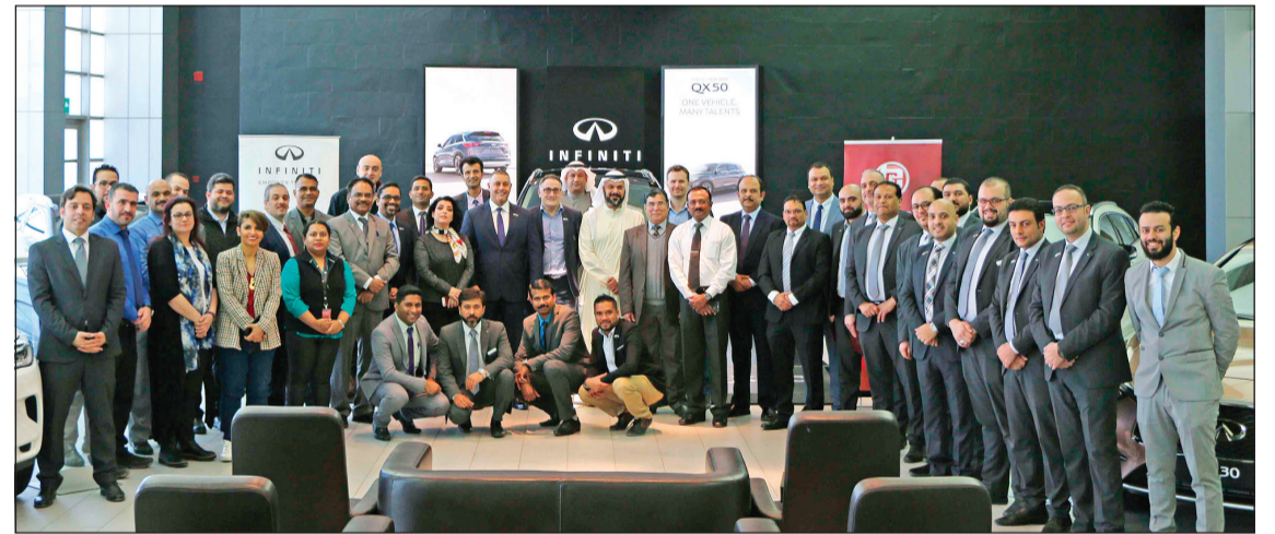
صورة جماعية لفريق عمل إنفينيتي الباطين

الرابحون سيتنافسون في مسابقة المهارات الإقليمية في دبي أبريل المقبل