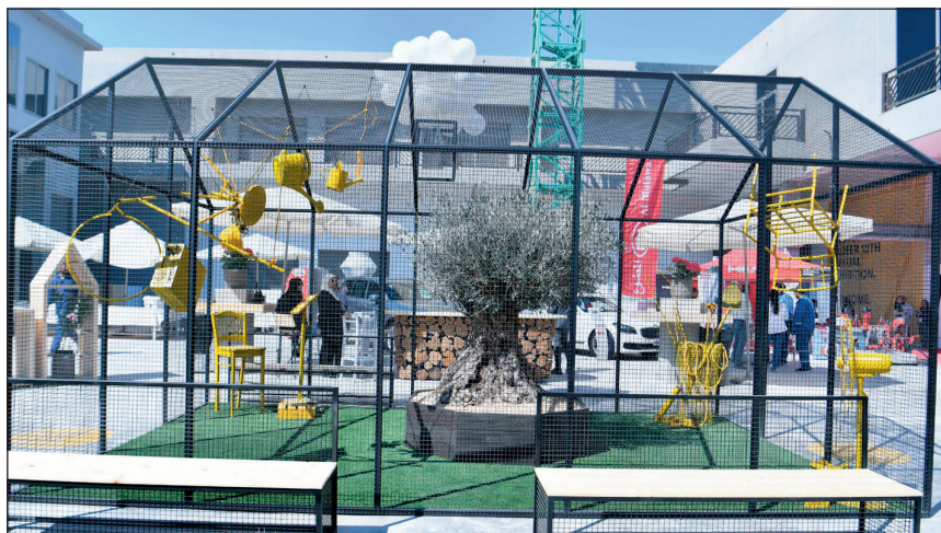
لوازم الحدائق كاملة في عرض فريد