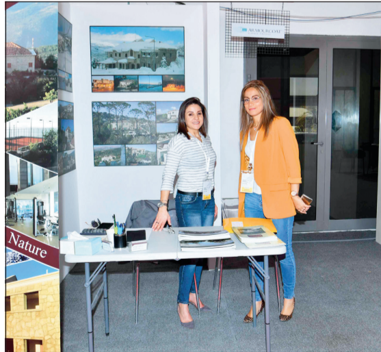
أحد الأجنحة المميزة