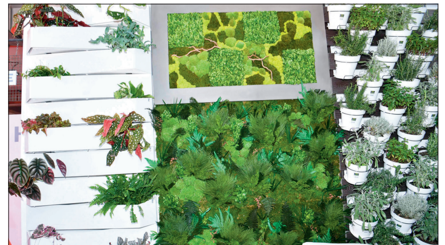
المعارض الخاصة بالحدائق