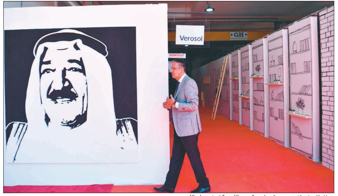
مدخل المعرض تزيين بصورة صاحب السمو الأمير الشيخ صباح الأحمد

المطوع: الشركة قامت بدور مهم في رفع مستوى المواد المستخدمة من جبس وإسمنت وبلاستيك مسلح بألياف الزجاج