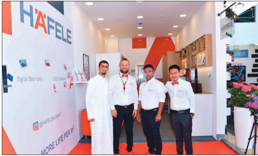
مدير شركة هافلي مع موظفيه في جناحهم

ومن جانب آخر أفاد المطوع بأن الشركة سعت خلال تاريخها في العمل بالسوق الذي يمتد لـ 46 عاما، إلى تطوير وتوسيع خبرتها في التصنيع والتصميم والمقاولات وذلك تماشيا مع التطور السريع في مجال التشطيبات الداخلية ومن أجل هذا الهدف تقوم الشركة باستقدام الأيدي الفنية المتخصصة والتقنيات الحديثة. كما عملت الشركة بالتعاون مع مصممين عالميين على تنفيذ مشاريع مميزة في مجال تطوير البنية الأساسية في الدولة من جامعات ومستشفيات ومتاحف ومبان عامة وفنادق وغيرها، لافتا إلى أنها وثقت علاقاتها أيضا مع معظم الشركات العاملة