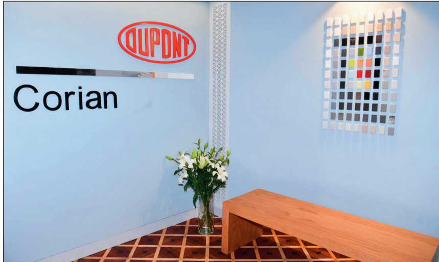
عرض لدرجات ألوان الحواشي لأحدى الشركات