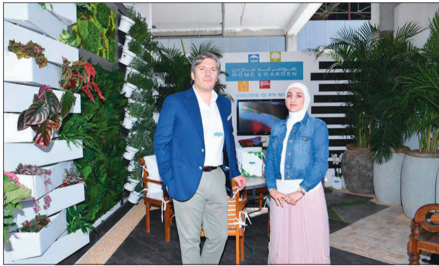
جناح شركة «هوم اند جاردن»

المطوع: «الصناعة بمعناها الحقيقي قائمة في بلدنا على النفط، أي صناعة المواد البتروكيماوية، ولهذا نأمل أن تقوم الجهات المعنية بتنشيط مصادر أخرى مثل الزراعة والثروة المائية، بحيث تتوسع الصناعات القائمة على المنتجات الزراعية كالتمور وخالقه وكذلك الثروة السمكية.» وعن تطوير الصناعة المحلية لتصبح الكويت في مصاف الدول المصدرة، قال «لست أدري إن كان من الصواب أن يكون هذا هو الهدف الإستراتيجي للكويت في هذه المرحلة، حيث إننا نتأثر بالأحداث التي تمر بالمنطقة، وبفضل الله تعالى فم حكمة صاحب السمو الأمير فسوف نعتبر من هذه المرحلة الصعبة بسلام.