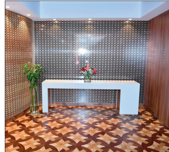
تصاميم وتجهيزات متناسقة