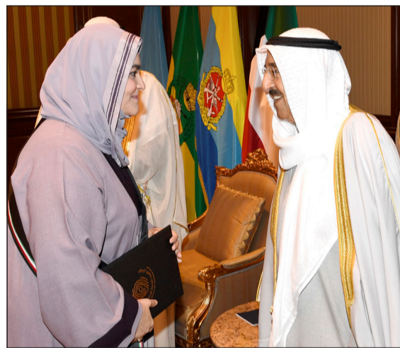
صاحب السمو الأمير وإبراهيم البغلي

ويعد سمو ولي العهد الشيخ نواف الأحمد ببرقية تعزية إلى الرئيس جابر بولسوارو رئيس جمهورية البرازيل الصديقة ضمنها سموه خالص تعازيه وصادق مواساته بضحايا الفيضانات نتيجة الأمطار الغزيرة التي اجتاحت مدينة ساو باولو البرازيلية والمناطق المحيطة بها، راجيا سموه للضححايا الرحمة والمصابين سرعة الشفاء. كما بعث سمو رئيس مجلس الوزراء الشيخ جابر المبارك ببرقية تعزية مماثلة.