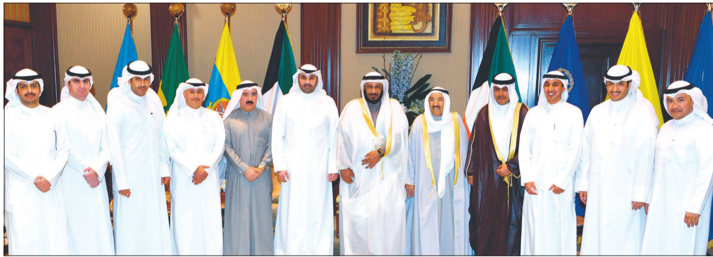
صاحب السمو الأمير الشيخ صباح الأحمد خلال استقباله سعد الخراز ورئيس وأعضاء مجلس إدارة جمعية المحامين

استقبل صاحب السمو الأمير الشيخ صباح الأحمد بقصر بيان صباح أمس نائب رئيس الحرس الوطني الشيخ مشعل الأحمد.