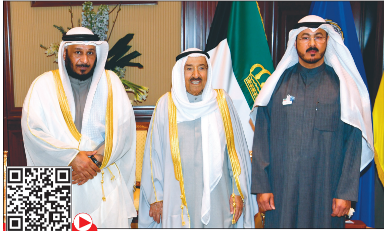
صاحب السمو الأمير الشيخ صباح الأحمد خلال استقباله سعد الخراز