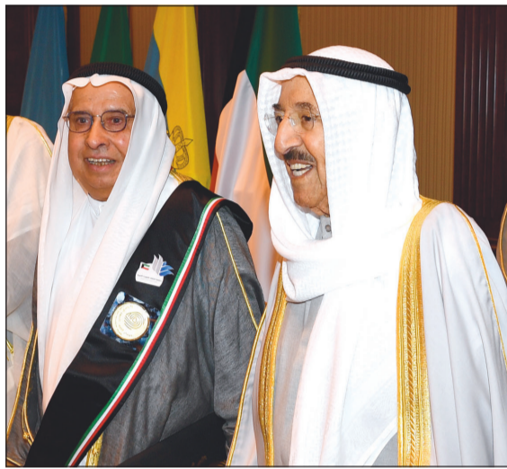
صاحب السمو الأمير وإبراهيم البغلي