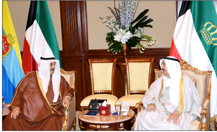
صاحب السمو الأمير الشيخ صباح الأحمد خلال استقباله سمو الشيخ ناصر المحمد