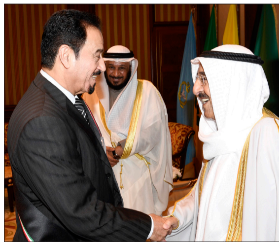
صاحب السمو الأمير وإبراهيم البغلي

وأضاف العجمي أن «التكريم الحقيقي والفوز الحقيقي يكمن في لقاء صاحب السمو والسلام عليه وهذا هو الدافع والمحفز لنا أسأل الله عز وجل أن يطول عمره على الطاعة وأن يديم عليه الصحة والعافية». أما عضو اللجنة المنظمة للشوابع في جمعية الملتي ضاري البعيجان فقال لقد «تشرفنا اليوم بلقاء قائد العمل الإنساني الشيخ صباح الأحمد الجابر الصباح وليس بغريب تكريمه لنا في هذا الاستقبال».