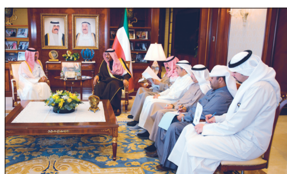
الشيخ صباح الخالد مستقبلا سفير قطر لدى الكويت بندر العتيبة

التي قدمها في إطار دعم وتعزيز العلاقات الثنائية التي تربط البلدين الصديقين في كل المجالات، معربا عن أطمح تمنياته له بالنجاح والتفوق في محطات عمله القادمة.