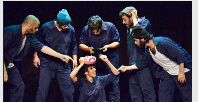
مشهد من مسرحية «الثاني من نوفمبر»