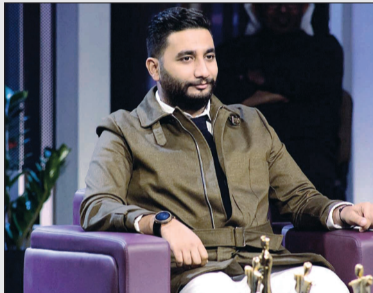
المخرج والمؤلف أحمد العوضي