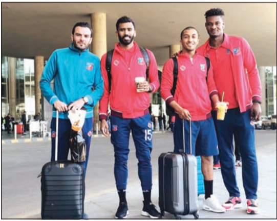
وفد «الأبيض» عقب وصوله إلى مطار عمان