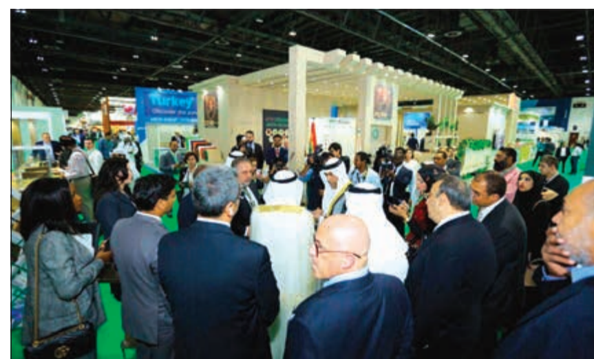
صورة أرشيفية من المعرض السابق

على مكائن الأخشاب بشكل أساسي إلى التزايد المستمر في الطلب على الأخشاب في البلدان النامية وخاصة في دول آسيا والمحيط الهادئ والشرق الأوسط وأفريقيا، إضافة إلى أميركا اللاتينية. وفي الوقت ذاته، أشار تقرير صادر عن مؤسسة «Eumabois» غير الربحية المتخصصة في مجال مكائن الأخشاب الأوروبية إلى أن ألمانيا تحتل المركز الأول أوروبياً في مجال صناعة مكائن الأخشاب وبخاصة سوقية تصل إلى 43٪، تليها إيطاليا بحصة سوقية تصل إلى 31٪، فيما أشار التقرير إلى دول أوروبية أخرى تنشط في مجال إنتاج مكائن الأخشاب بما في ذلك النمسا بنسبة 5٪ من السوق، وإسبانيا بنسبة 3٪ وأخيراً تركيا بنسبة 2٪.