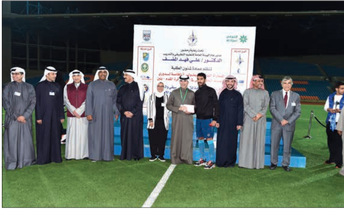
تكريم الفرق الفائزة بحضور ممثلي البنك والهيئة العامة للتعليم التطبيقي والتدريب

أصحاب حساب @Tijari. من جانبهم، عبر مسؤولو الهيئة العامة للتعليم التطبيقي عن شكرهم الجزيل للبنك التجاري الكويتي على رعاية البطولة والتي تضاف إلى سجل البنك المضيء في مجال المسؤولية الاجتماعية وجهوده المستمرة لتحقيق التنمية الاجتماعية المستدامة.