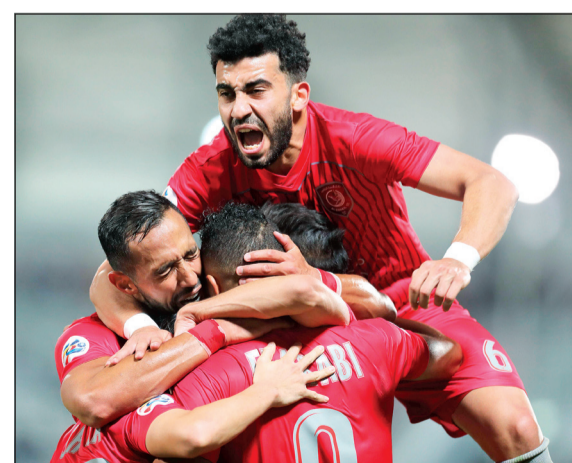
فرقة لاعبي الدحيل بالفوز على الاستقلال

خلال الفترة من 22 يونيو، إلى 20 يوليو المقبلين. وتتحه النية في الاتحاد المصري لكرة القدم بالتنسيق مع لجنة المسابقات لإنهاء مسابقة كأس مصر قبل انطلاق مسكر المنتخب في 4 يونيو، وذلك من أجل إخطار الاتحاد الأفريقي «الكاف» باسم بطل كأس مصر، والأمر البديل أن يحصل الاتحاد المصري على استثناء من «الكاف» بتأجيل تسمية الفرق الثلاثة (بطل الدوري وصيفه وبطل الكأس) إلى أغسطس المقبل. وفي شأن متصل بتنظيم مصر لبطولة الأمم الأفريقية،