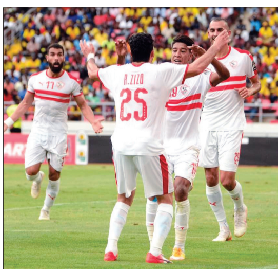
الزمالك يستعد لجدولة الحسم الأفريقيّة

تصل القاهرة الأحد المقبل لجنة من الاتحاد الأفريقي لكرة القدم، للتفتيش على الملاعب، والمنشآت والفنادق قبل رفع تقريرها النهائي للكاف. ويستعد فريق الإسمايلي لجدولة ضاغطة بين بطولة أفريقيا والدوري، حيث يواجه مازيميري الكونغولي غدا الجمعة ثم مواجهة سموحة في الدوري الثلاثاء المقبل، بعدها يغادر لمواجهة الأفريقي لدور مجموعات دوري الإبطال. والذين لم يشاركوا في مباراة الزمالك الأخيرة أمام بترو اتلتيكو الأنغولي.