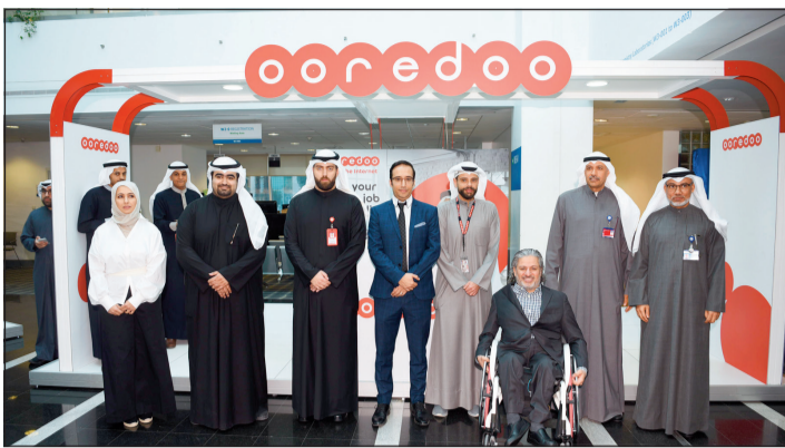
الحضور في جناح أوريدو