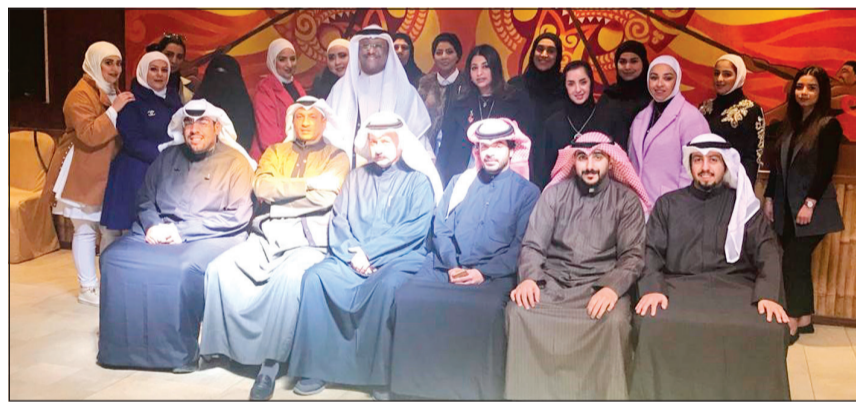
صورة جماعية للمتدربين

من الضروريات التي يجب أن تلتزم بها الإدارات الحكومية إضافة إلى التخطيط والوقاية من المشكلات الروتينية. وتطرق د.نوفل إلى البوابة الإلكترونية وأهميتها عارضا فكرتها وأسباب إنشائها والحاجة الحكومية لها مؤكدا تقديم الخدمات من خلال البوابة الإلكترونية، مشيرا إلى ضرورة التميز خلال البوابة الإلكترونية لكافة الإدارات الحكومية تحت شعار بوابة الإلكترونية مقياس لنجاحك مع تفعيل التواصل الإلكتروني كإدارات منفصلة تحت مسمى الإدارة الإلكترونية مع امتلاك أساليب ومهارات التواصل الاجتماعي.