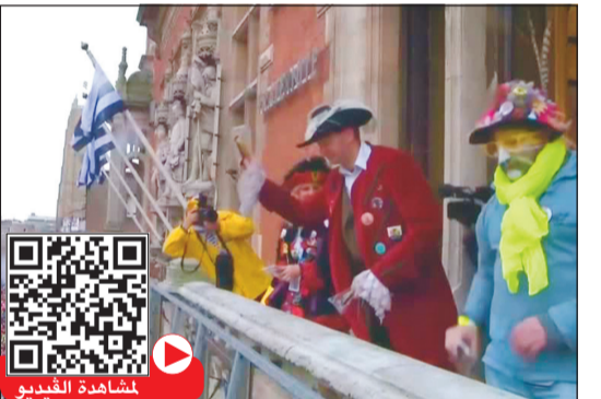
ألقي رئيس بلدية دنكيرك الفرنسية السمك المملح على عشرات الآلاف ممن جاءوا للاحتفال بمهرجان المدينة السنوي، ويعتبر إلقاء السمك تقليدا رئيسيا به.

وارتدى الآلاف ملابس تنكرية زاهية الألوان وتدفقوا إلى شوارع مدينة دنكيرك الساحلية بشمال فرنسا، مع انطلاق أقدم الكرنفالات الفرنسية وأكثرها جنونا هذا الأسبوع.