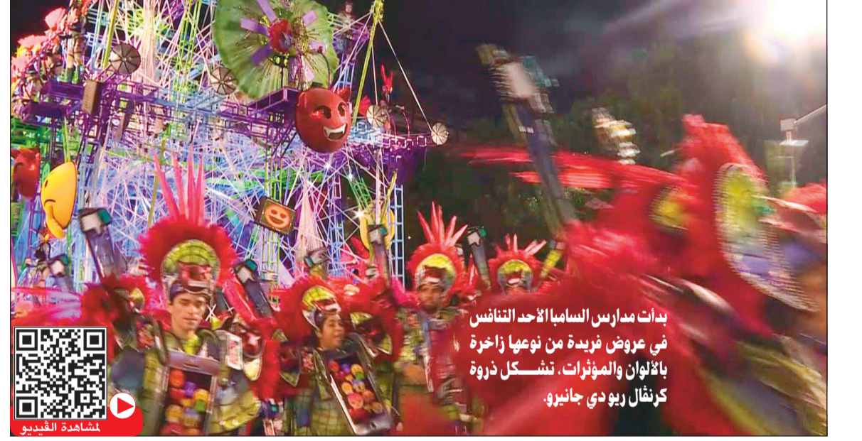
بدأت مدارس السامبا الأحد التانفس في عروض فريدة من نوعها زاخرة بالألوان والمؤثرات، تشكل ذروة كرنفال ريو دي جانيرو.