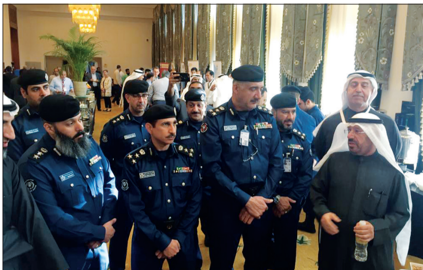
قيادات من الإدارة العامة للإطفاء شاركت في افتتاح المعرض المصاحب للمؤتمر