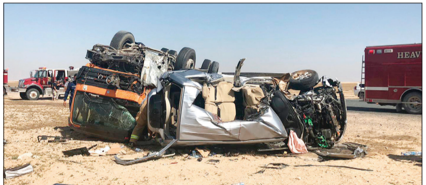
المركبتان وقد تهشمتا تماما بفعل الاصطدام

فيما نقل سائق التانكر السريلاكي إلى مستشفى الجبراء لتلقي العلاج. وكان مركز عمليات الداخلية قد تلقى بلاغا بالحادث، حيث هرع على الفور الدوريات الأمنية وسيارات الطوارئ الطبية، وشوهدت المركبتان محطمتين نتيجة التصادم العنيف بينهما.