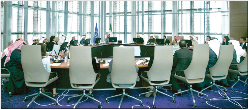
جانب من الحلقة النقاشية

وحضر الحلقة النقاشية عدد من موظفي بنك الكويت المركزي، وتحدث الحاج حول المستجدات الاقتصادية والمتغيرات المالية على المستوى العالمي والتحول التي يقرضها التطور التقني على هذه الصناعات والخدمات المالية والتجارية، والدور المطلوب من القائمين عليها لتطويرها والاستفادة من الفرص الواعدة للنمو في هذا المجال.