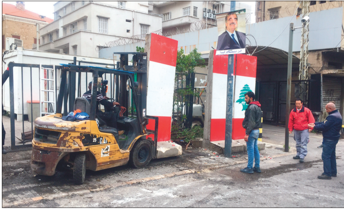
تيار المستقبل خلال مباشرة بازالة الحواجز الاسمنتية امام مقراته في منطقة القنطاري ببيروت انسجاماً مع قرار وزير الداخلية ريبا الحسن (محمود الطويل)

وتبدو اوساط الحزب التقدمي الاشتراكي واثقة من وجرار وزير الداخلية ريبا الحسن (محمود الطويل)