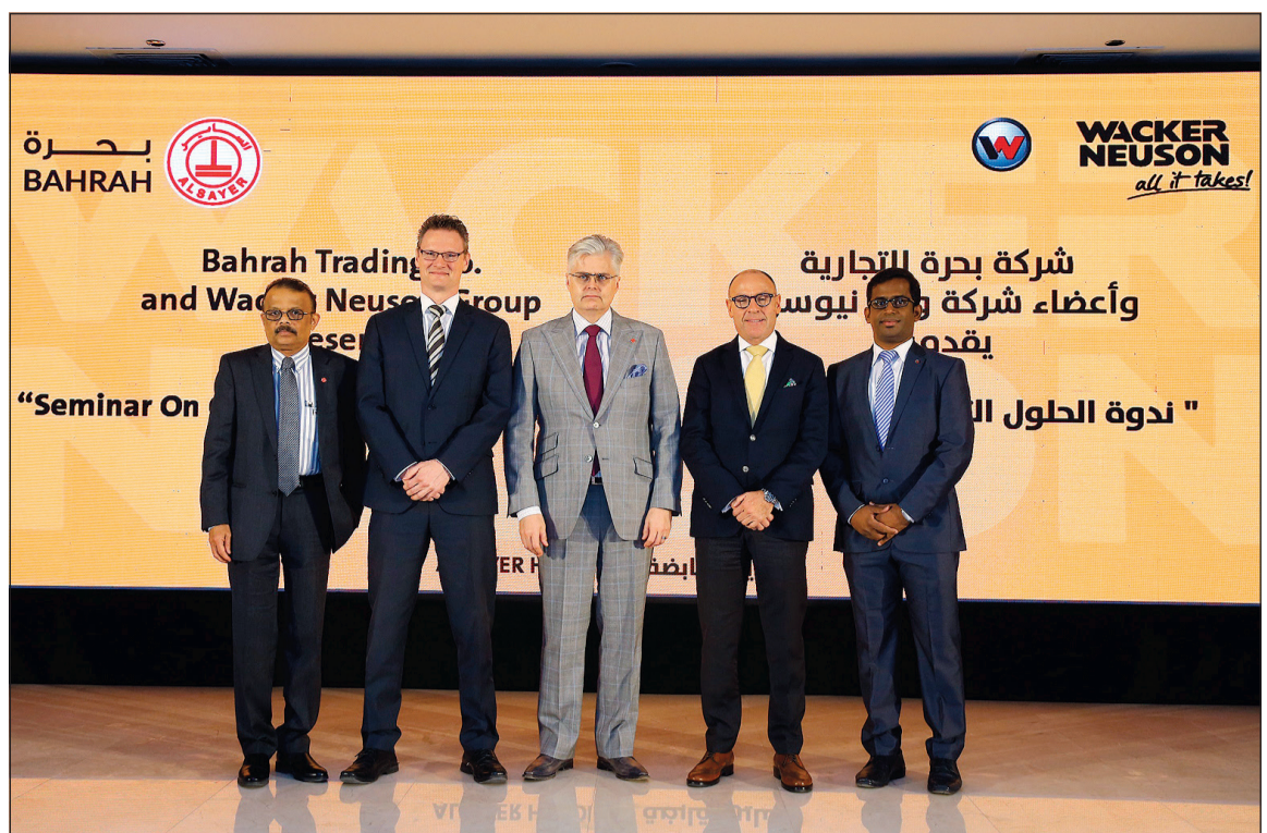
صورة جماعية لإداريي «الساير» و«بحرة» و«واکر نیوسون»