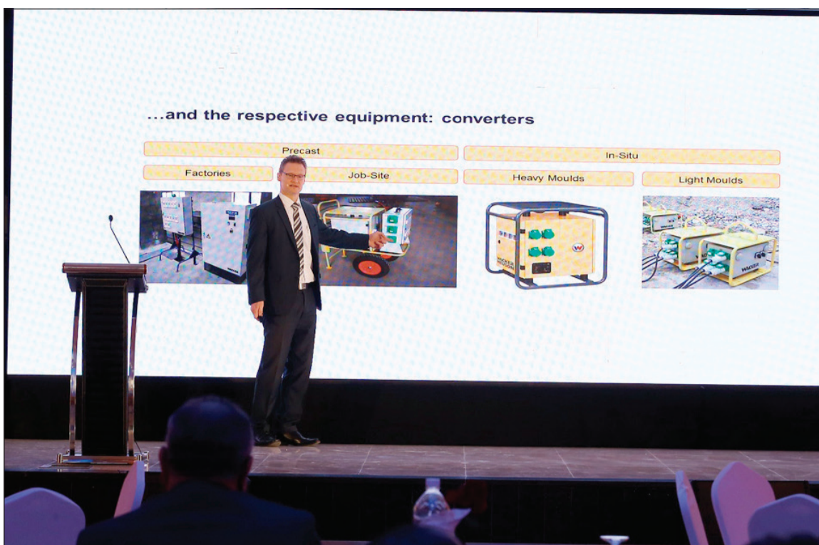
جانبا من الندوة