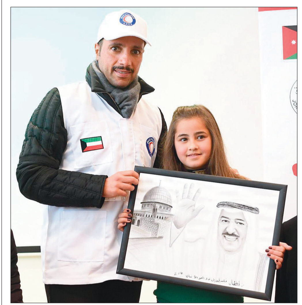
رئيس مجلس الأمة مرزوق الغانم مع طفلة فلسطينية تحمل لوحة تعبيرية لصاحب السمو الأمير والقدس

الغانم: جهود الأمير ساهمت في رفع معاناة اللاجئين السوريين والفلسطينيين 12