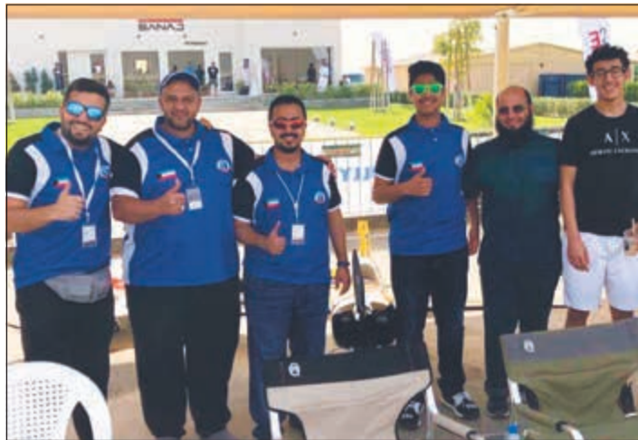
فريق النادي العلمي للطيران اللاسلكي المشارك في بطولة دبي ماسترز الدولية الأولى للطيران اللاسلكي 2019