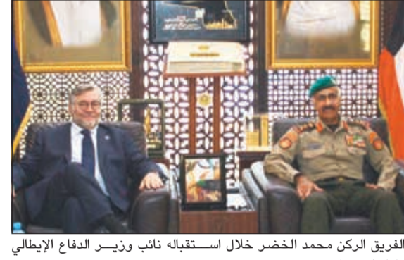
الفريق الركن محمد الخضر خلال استقباله نائب وزير الدفاع الإيطالي رافاييليه فولبي

عمّان - «كونا»: أهاب سفيرانا لدى الأردن الديحاني بالمواطنين الكويتيين الموجودين بالأردن أخذ الحيطة والحذر من الظروف الجوية السائدة في البلاد التي تشهد هطول أمطار غزيرة مصحوبة برياح شديدة. وأكد استعداد السفارة التام لتقديم المساعدة للمواطنين الكويتيين بالمملكة على مدار الساعة من خلال الأرقام التالية: (0096265675135 - 0096265675136).