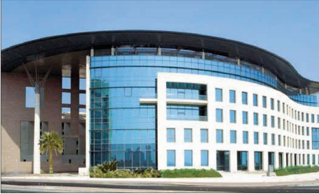
مبنى البنك الأهلي المتحد - البحرين