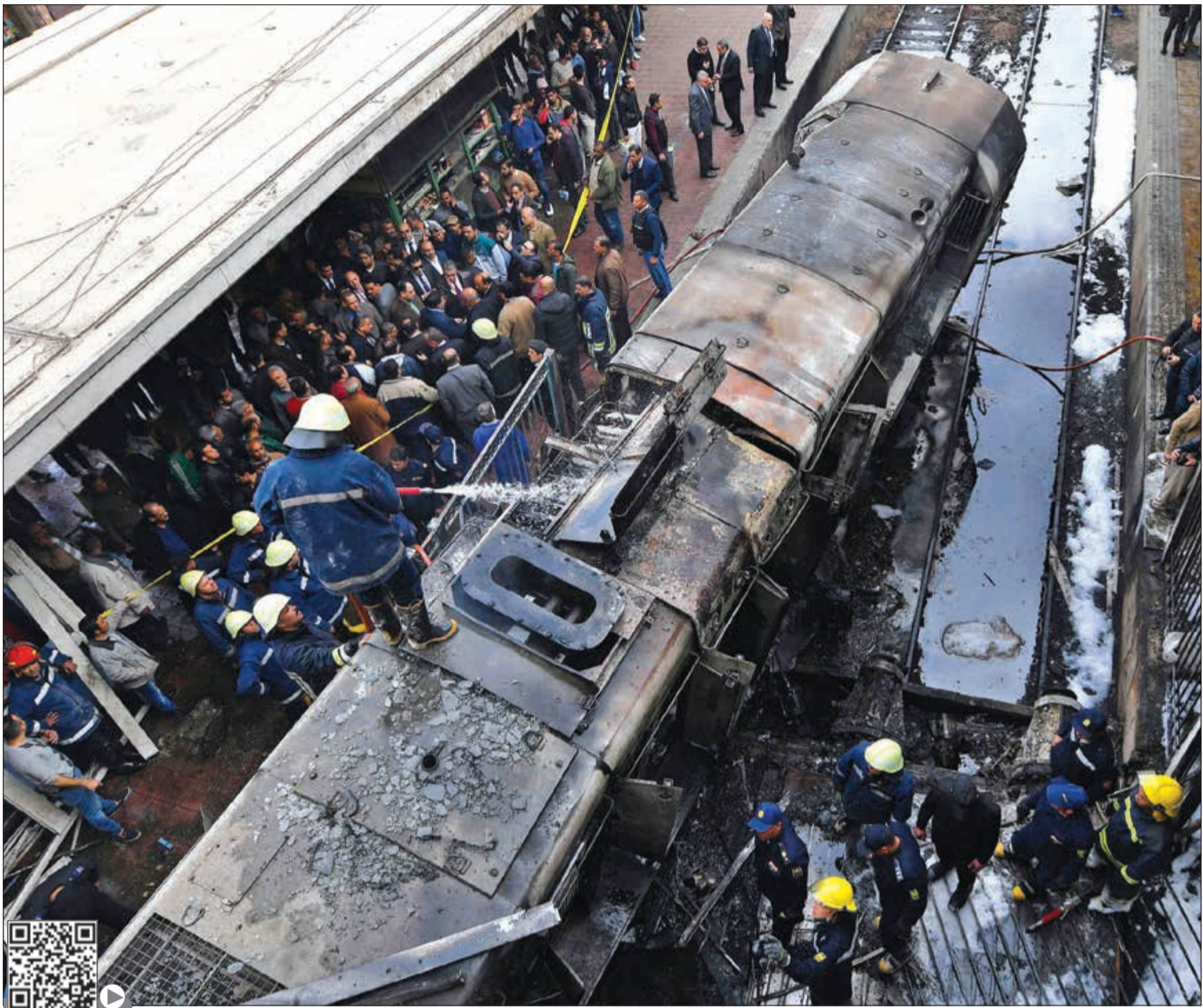
رجال الإطفاء ومنتقلون مصريون في موقع حادث حريق «محطة مصر» أمس

ألقت رجال المباحث القبض على سائق الجرار 2302، والذي اصطدم برصيف رقم 6 بمحطة سكة حديد رمسيس، مما أدى إلى اندلاع الحريق داخل المحطة وهرعت سيارات الإطفاء إلى المكان وتمت السيطرة عليه، وتم اتخاذ كافة الإجراءات ضده، وإحالته للنيابة التي باشرت التحقيق.