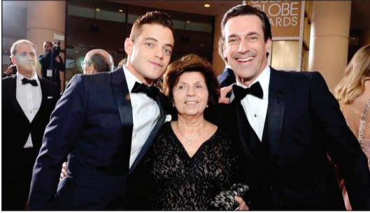
رامي مالك مع والدته