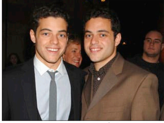
رامي مالك وشقيقه التوأم سامي