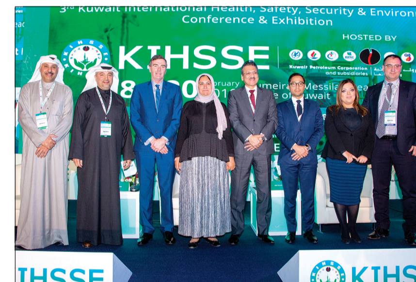
جانب من مشاركة «إيكويت» في المؤتمر والمعرض

المعايير الصارمة التي تتبعها في تقييم إجراءاتها، وتفاهيتها المستمر في حماية الأفراد والمجتمعات والبيئة. كما تعتبر إيكويت أيضاً أول جهة في الكويت تحصل على اعتماد وشهادة الرعية المسؤولة المعروفة عالمياً، وهي أيضاً مثال يحتذى به عالمياً بفضل إنجازات شركتها التابعة «أم إي جلوبل» التي تم اختيارها كأحدى الشركات الأكثر أماناً في كندا خلال أكتوبر الماضي، حيث فازت بالجائزة الذهبية عن قطاع الكيمياء. وقد حصدت الشركة جوائز عالمية بفضل إجراءاتها المتكاملة في الحفاظ على السلامة، والريادة في تطوير المجالات ذات العلاقة،