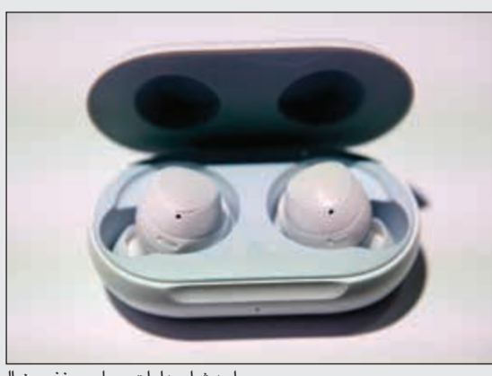
أحدث إصدارات «سامسونغ» من السماعات اللاسلكية والساعات الذكية