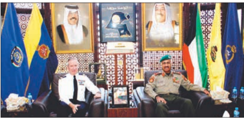
رئيس الأركان الفريق الركن محمد الخضر مستقبلاً العقيد الركن طيار باتريك بيكيه

الإهتمام المشترك لاسيما المتعلقة بالجوانب العسكرية وسبل تطويرها وتعزيزها بين البلدين الصديقين.