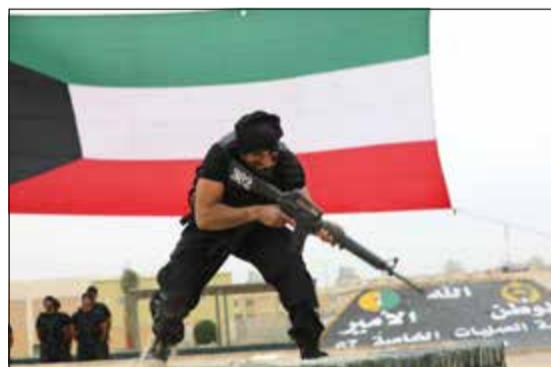
جاهزية تامة للتعامل مع الأحداث الميدانية

ومذكرات تعاون مع المؤسسات الأمنية المتطورة لمواكبة لأفضل الأساليب التدريبية. وأشار إلى أن هذه النخبة من رجال الصاعقة سواء من الحرس الوطني أو الجيش والشرطة هي مدعاة للفخر والاعتزاز لأنها تضيف لبنة أخرى من لبنات الأمن والاستقرار لصرح الوطن، معبراً عن شكره وتقديره لكل المسؤولين عن إعداد وتدريب الدورة. من جانبه، قدم قائد كتية العمليات الخاصة العقيد الركن جراح ناصر إيجازاً عن المراحل التدريبية لدورة الصاعقة التأسيسية والتي تم التركيز فيها على المياقة البدنية واكتساب المهارات الفردية والقدرة على تحمل مواجهة الصعاب باختلاف مناطق التدريب والبرامج التدريبية المتنوعة التي شملتها الدورة.