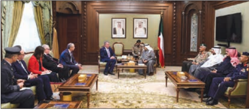
الشيخ ناصر صباح الأحمد مستقبلاً وزير التجهيز العسكري البريطاني ستيفارت اندرو

التبريكات بمناسبة مرور 13 عاماً على تولي سموكم ولاية العهد والثقة الغالية التي حظيتم بها من صاحب السمو الأمير. ودعا المولى عز وجل «إن يمشي على سموكم بنعمتي الصحة والعافية لمواصلة مسيرة الخير والعطاء كما نعاهد سموكم باننا على الولاء والوفاء وحمل الأمانة باقون في المحافظة على أمن واستقرار بلدنا العزيز».