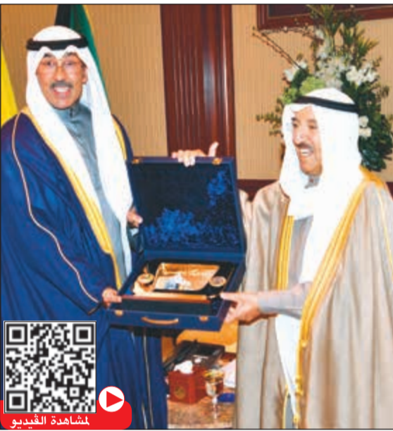
صاحب السمو الأمير يتسلم هدية تذكارية من الشيخ فواز الخالد