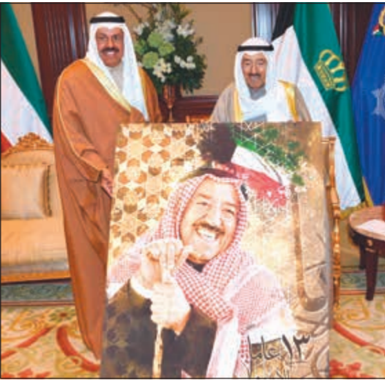
صاحب السمو يتسلم هدية من الشيخ أحمد النواف