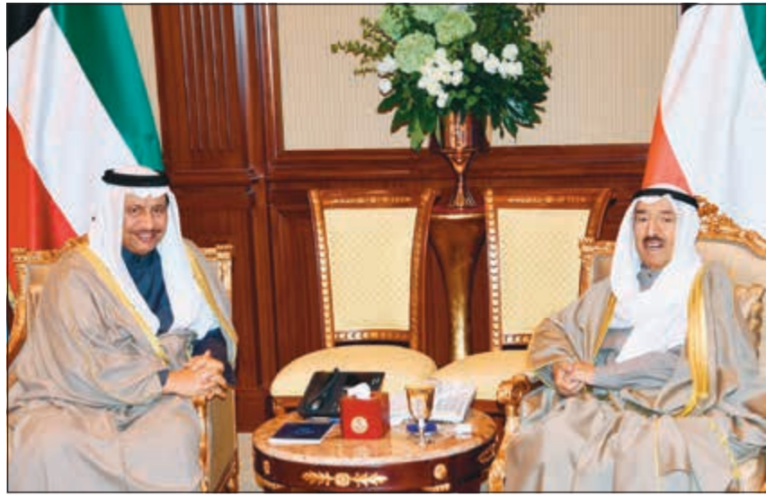
صاحب السمو الأمير الشيخ صباح الأحمد مستقبلاً سمو رئيس مجلس الوزراء الشيخ جابر المبارك