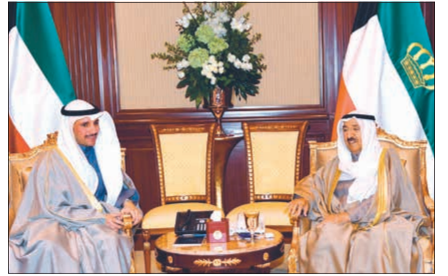
صاحب السمو الأمير الشيخ صباح الأحمد مستقبلاً رئيس مجلس الأمة مرزوق الغانم